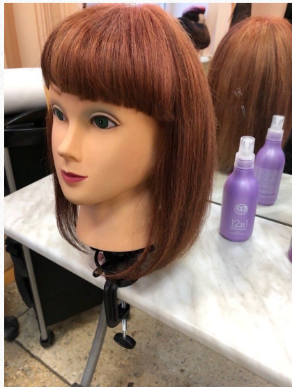
Стрижка «классическое каре»