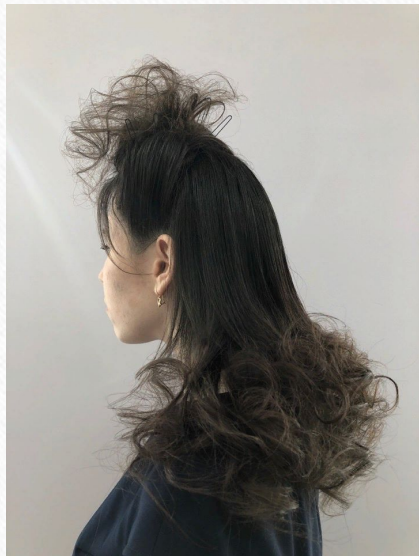
Сложная прическа для показа