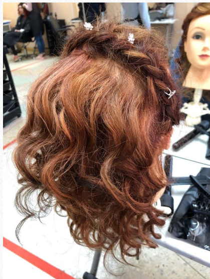
Кудри с плетением