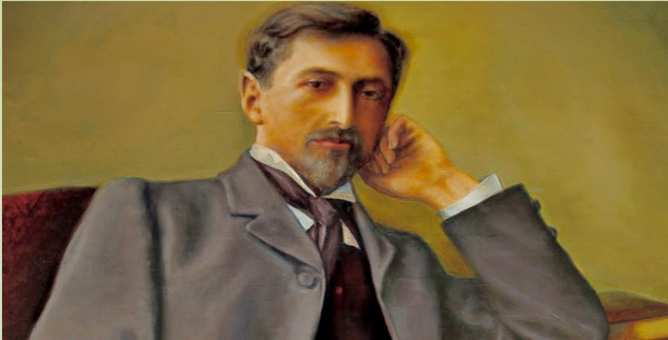
Иван Алексеевич Бунин