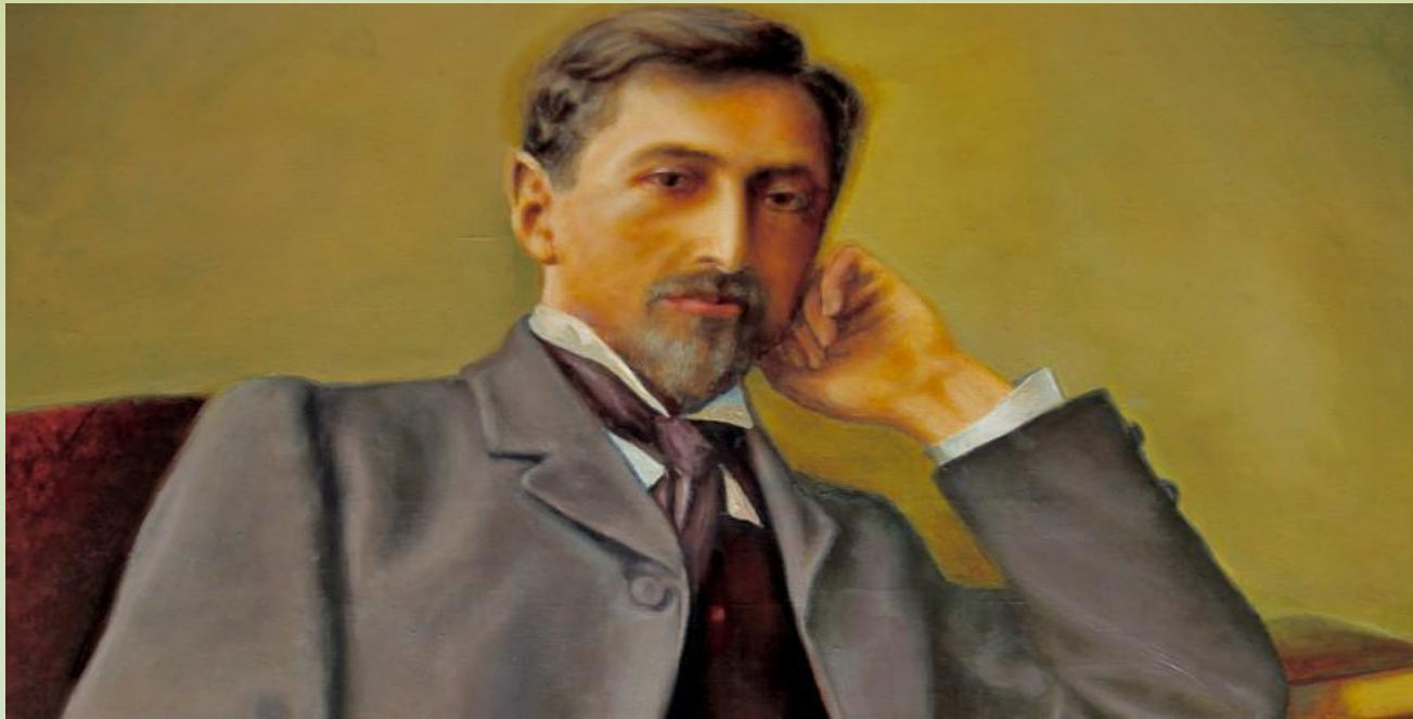
Иван Алексеевич Бунин