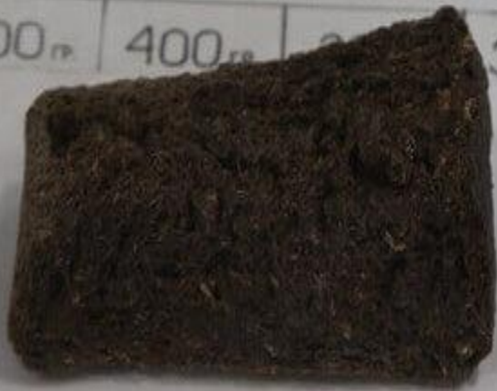
Вот он, блокадный кусочек хлеба. Сто двадцать пять граммов на весь день.