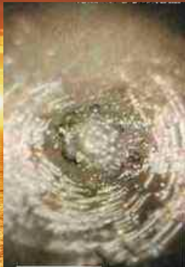
Кристалл после воздействия слов «Ты - дурак»