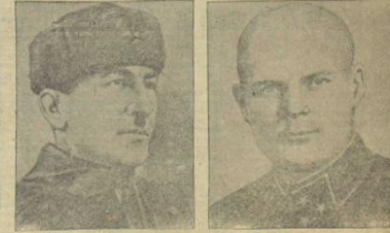
Генерал-майор Г. К. Жуков