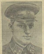
Генерал-майор А. А. Власов