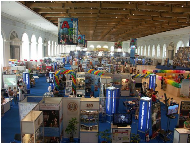
Ярмарка школьно-письменных принадлежностей.