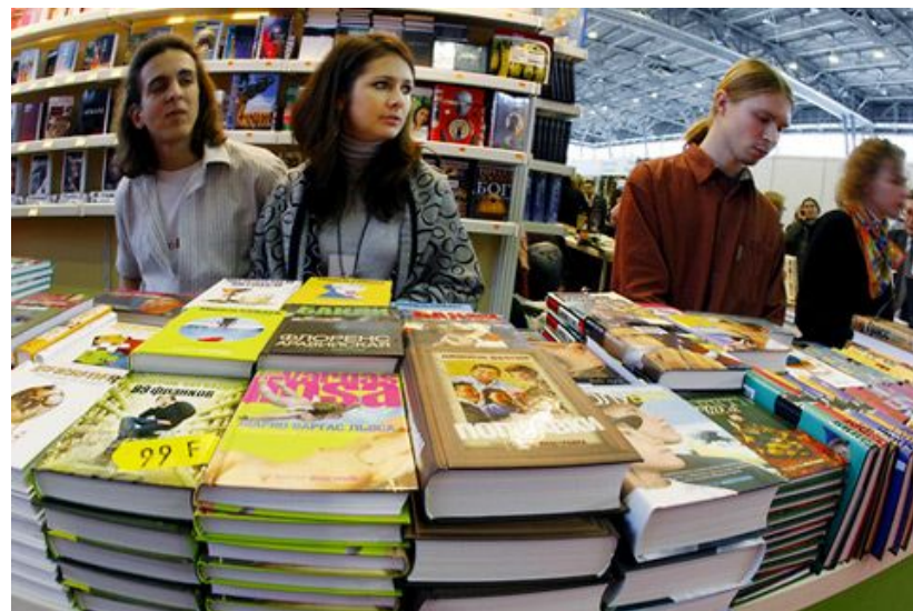
Ярмарка продажи книг, одежды и т. д.