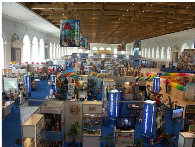
Ярмарка школьно- письменных принадлежностей.