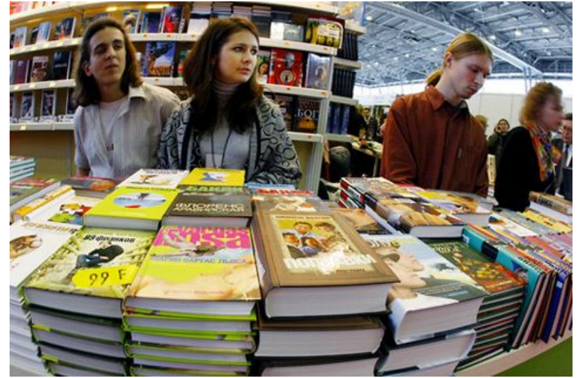
Ярмарка продажи книг, одежды и т. Д.