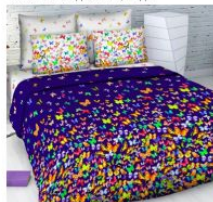
5454 «Вихрь бабочек»