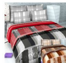
5380 «Кружевная фантазия», вид 2