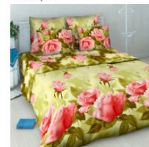
4172 «Нежная роза»