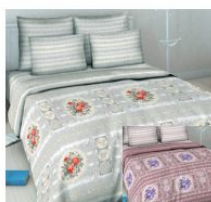
5378 «Королевский фарфор», вид 1