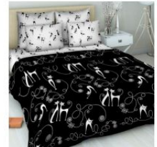
3369 «Царская особа»