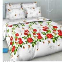
5664 «Свежесть утра»