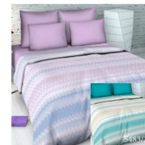
5483 «Новая волна», вид 1