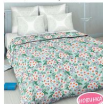
7004 «Время любить»