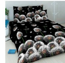
3412 «Белые одуванчики»