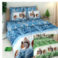
4486 «Белочки», вид 1