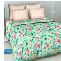
5878 «Пленительный аромат», вид 2