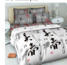
4038 «Символ благополучия»