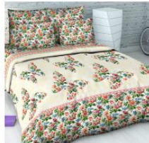
5063 «Яркие мгновения»