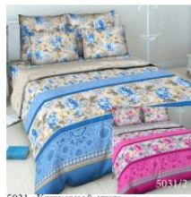
5031 «Кружевной стиль»