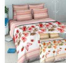
4562 «Розовый вальс»