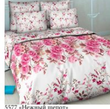
5577 «Нежный шепот»