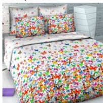
5455 «Вихрь бабочек»