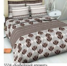
5534 «Кофейный аромат»