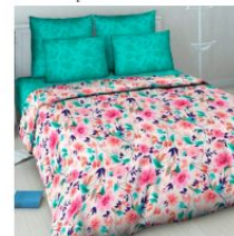
5878 «Пленительный аромат», вид 1