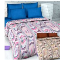
5762 «В ритме танца», вид 1