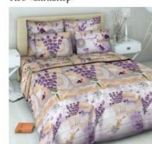
4399 «Шанталь лаванда»