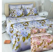
3866 «Японское утро», вид 1