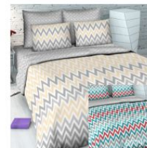
5779 «Модный зигзаг», вид 1