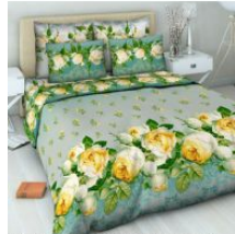
4315 «Французский аромат», вид 1