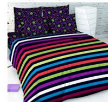
5343 «Цветные сны»