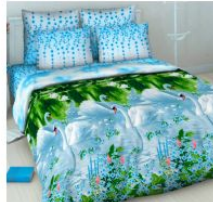
5411 «Белые лебеди»