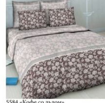
5584 «Кофе со льдом»