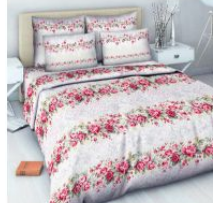
4618 «Французский шарм»