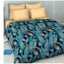
5619 «Сказочная ночь»