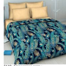
5619 «Сказочная ночь»