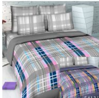
5413 «Ритм», вид 1