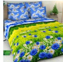
4268 «Васильковое поле»