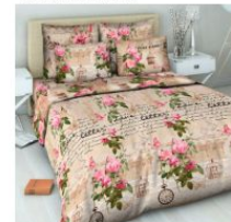
4400 «Шанталь роза»