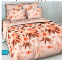
5114 «Дивный аромат»