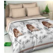
5759 «Тажная сказка»