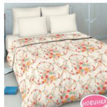
7021 «Цветочный хоровод»