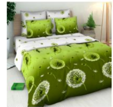
3413 «Дуновение ветра»