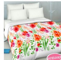
7023 «Акварельная роскошь»