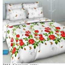
5664 «Свежесть утра»