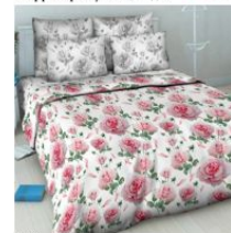
5880 «Воздушная акварель»