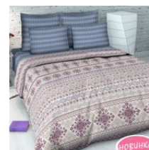
«Территория уюта», вид 2