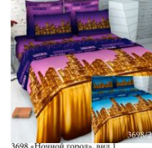
3698 «Ночной город», вид 1