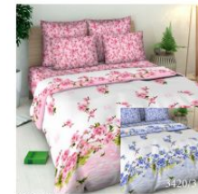
3420 «Цветение персика», вид 1