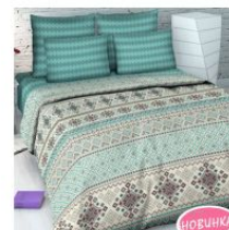
«Территория уюта», вид 1