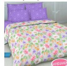
7020 «Для тебя»