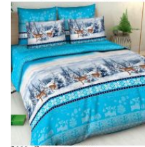
5666 «Северная сказка»