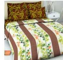
5112 «Музыка востока»