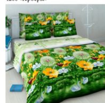
4040 «Аура лета»