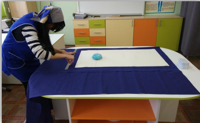
подготовка деталей основы платья к раскрою