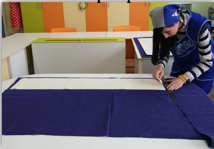
подготовка деталей волана к раскрою