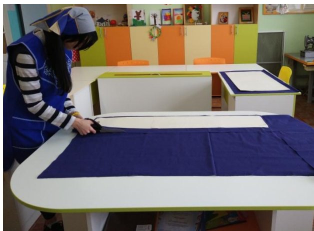
раскрой деталей волана