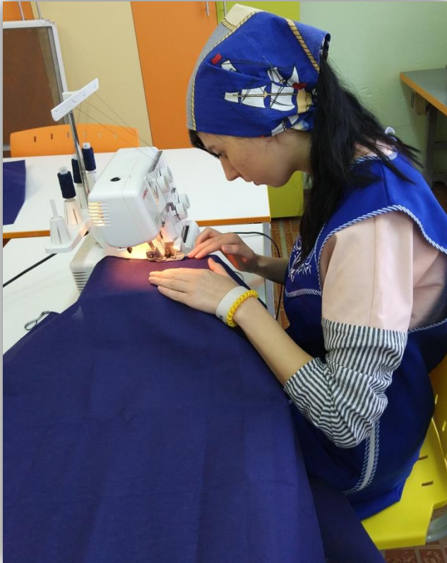
обработка боковых срезов деталей основы платья оверлоком