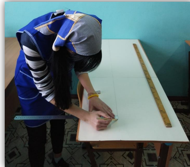
построение чертежа волана