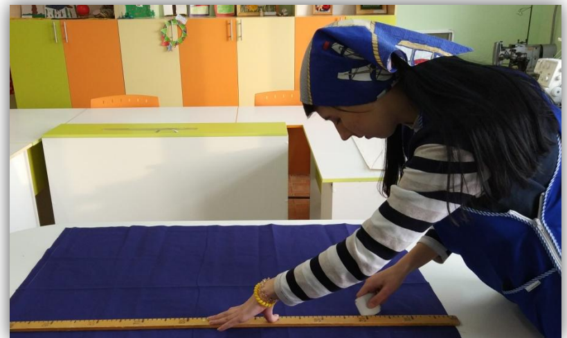
подготовка деталей кулиски к раскрою