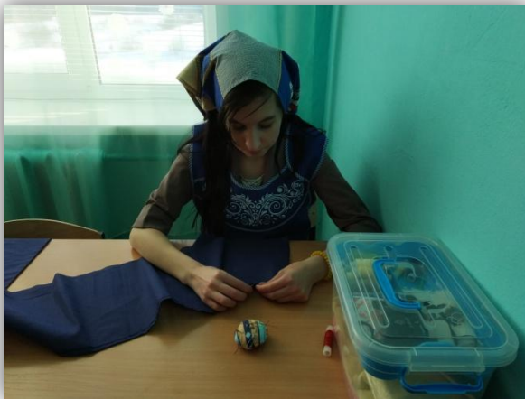
3. обработка нижнего среза волана швом вподгибку с открытым срезом