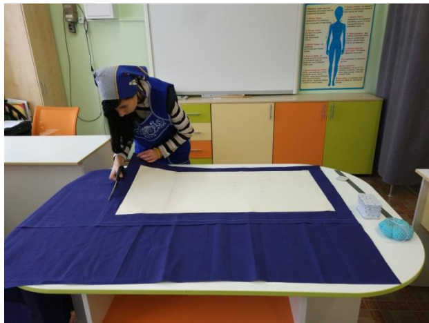
раскрой деталей основы платья