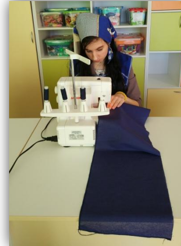
2. обработка нижнего среза волана оверлоком