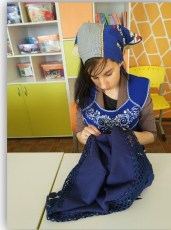
4. приметывание и притачивание кружевной тесьмы