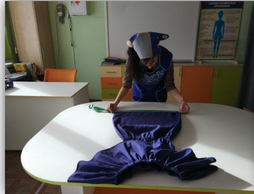
2. разметка длины кружевной тесьмы