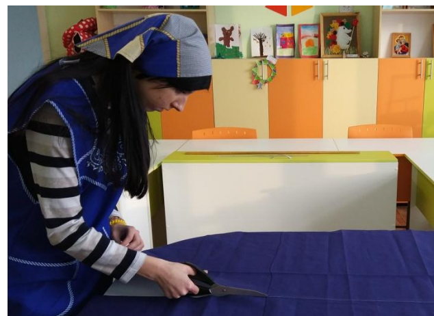
раскрой деталей кулиски