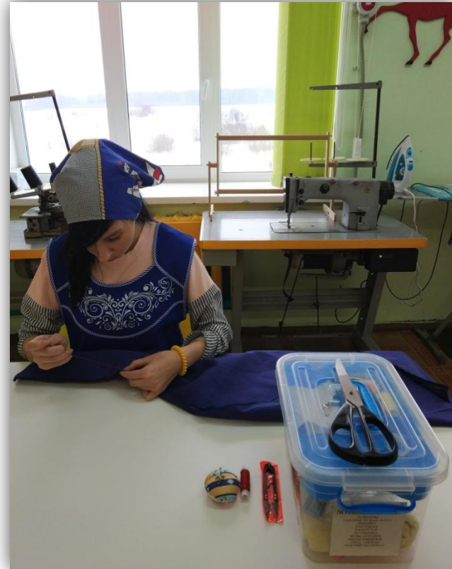
сметывание боковых срезов деталей основы платья