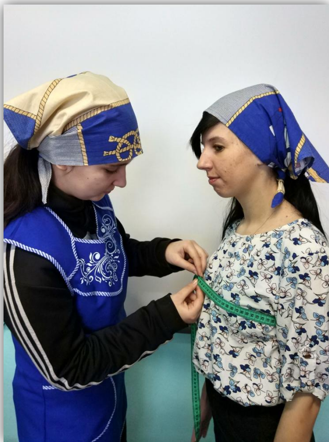
Полуобхват груди (Сг)