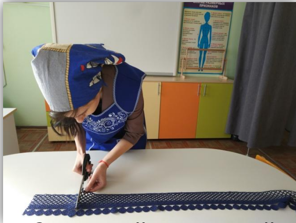
3. раскрой кружевной тесьмы