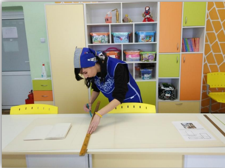
построение чертежа основы платья