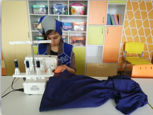
1. обработка нижнего среза изделия оверлоком