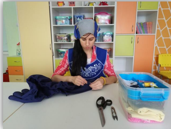
3. вдевание резиновой тесьмы