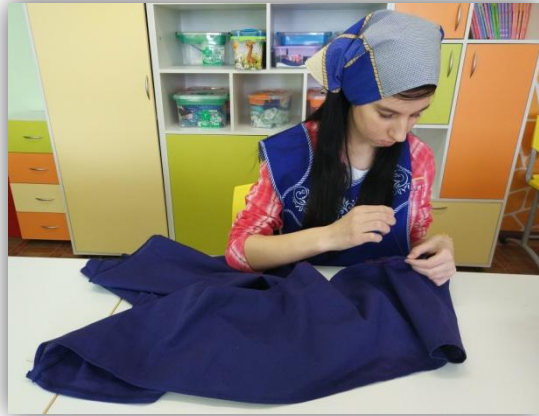
1. заметывание верхнего среза изделия

б) соединение волана с верхней частью изделия, вдевание резиновой тесьмы