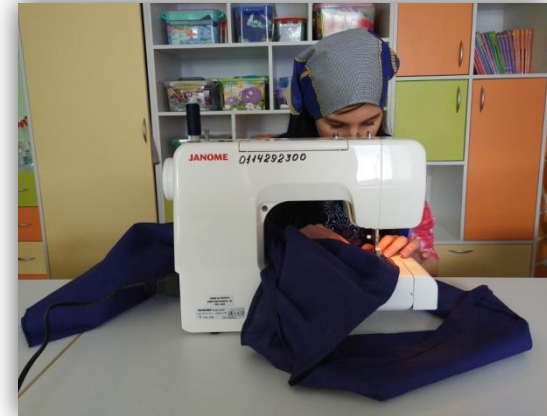
2. застрачивание верхнего среза изделия