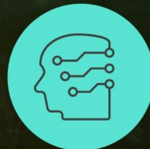
IT и ТРЕЙДЕРЫ