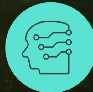
IT и ТРЕЙДЕРЫ