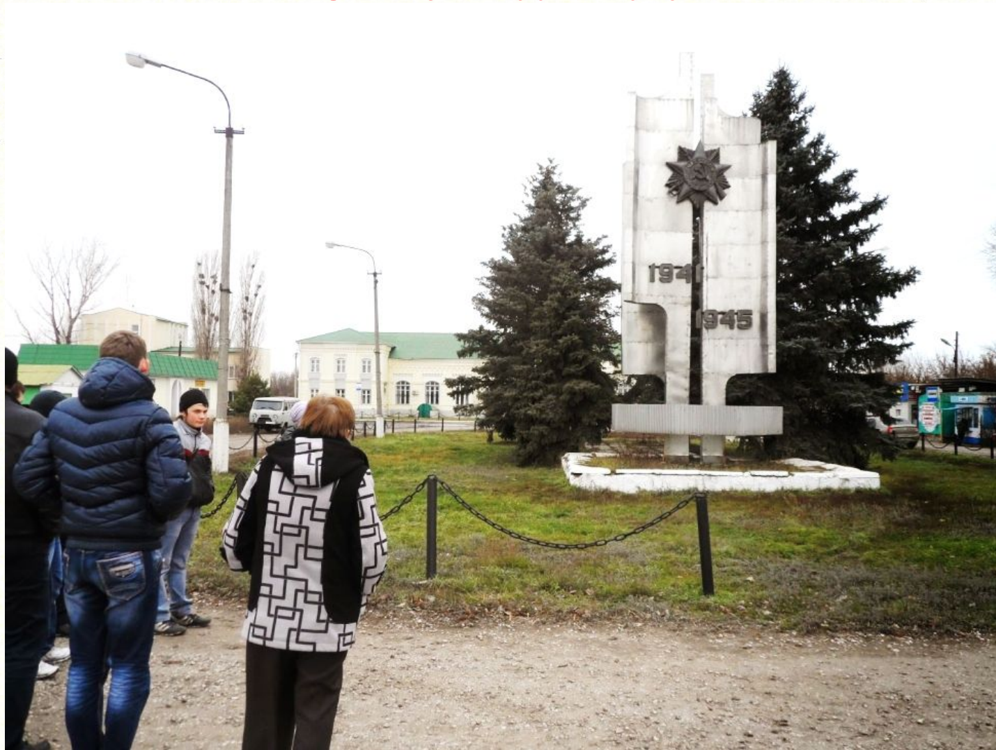
Символический памятник воинам –землякам погибшим в боях за Родину на территории привокзальной площади станции Филоново города Новоаннинского.