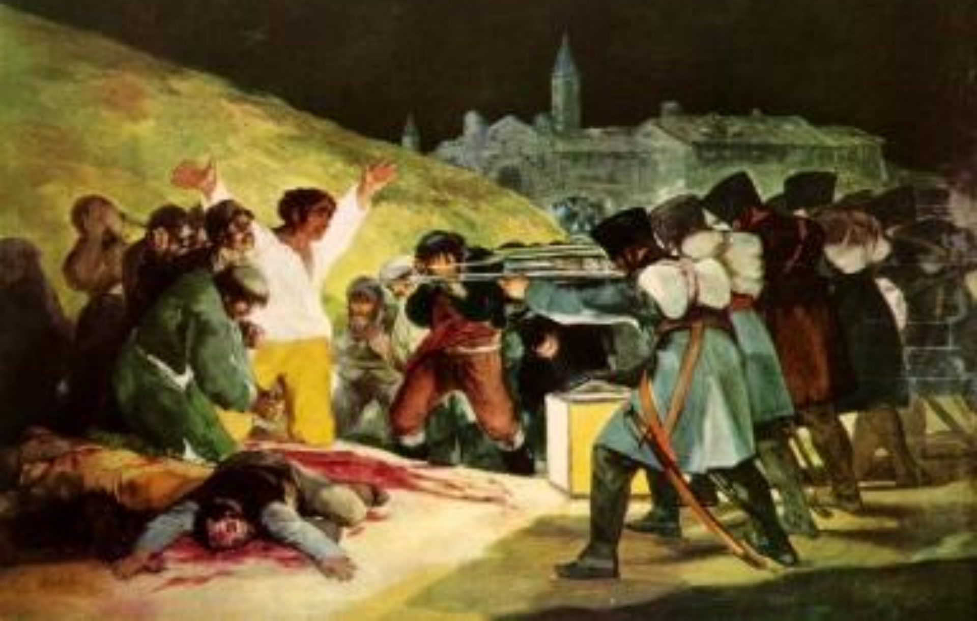
Ф. Гойя «Расстрел повстанцев в ночь со 2 на 3 мая 1808 года»