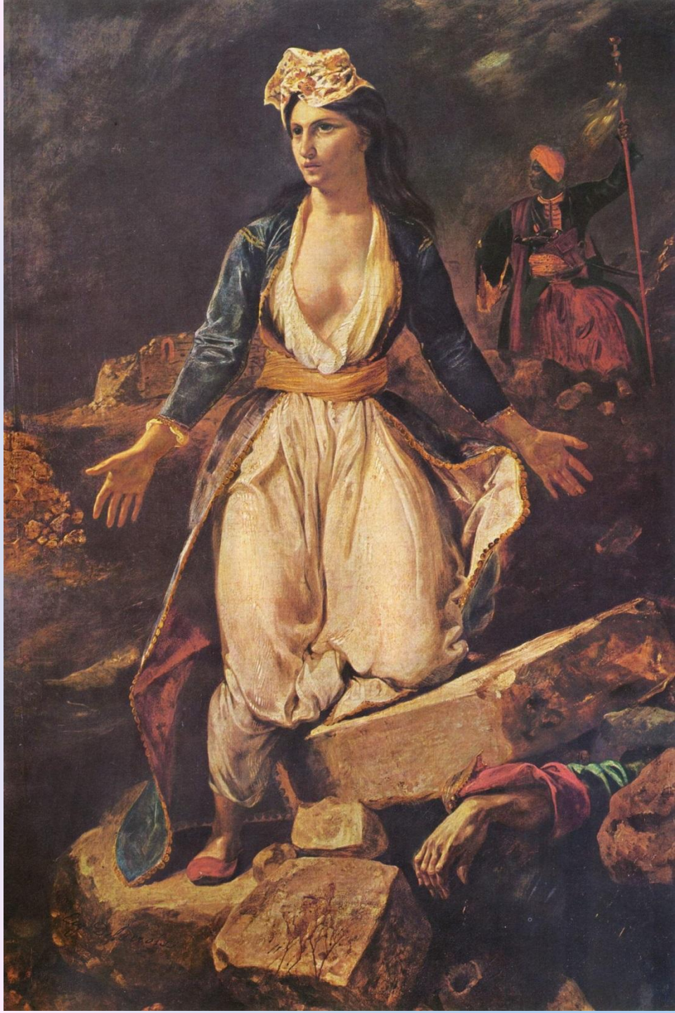
Э. Делакруа. Скорбящая Греция на развалинах Миссолонги.