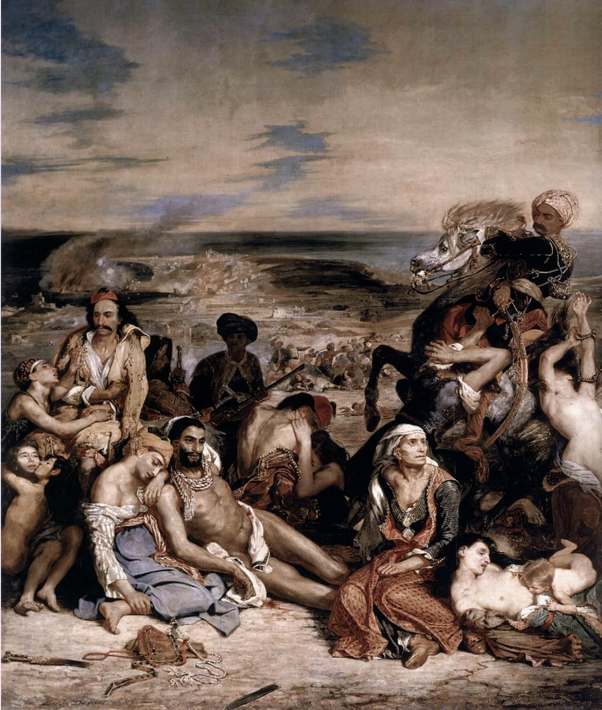
Эжен Делакруа «Резня на Хиосе». 1824 год.