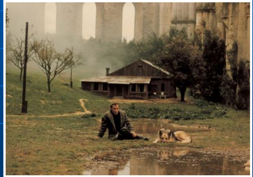
«Сталкер» Андрей Тарковский