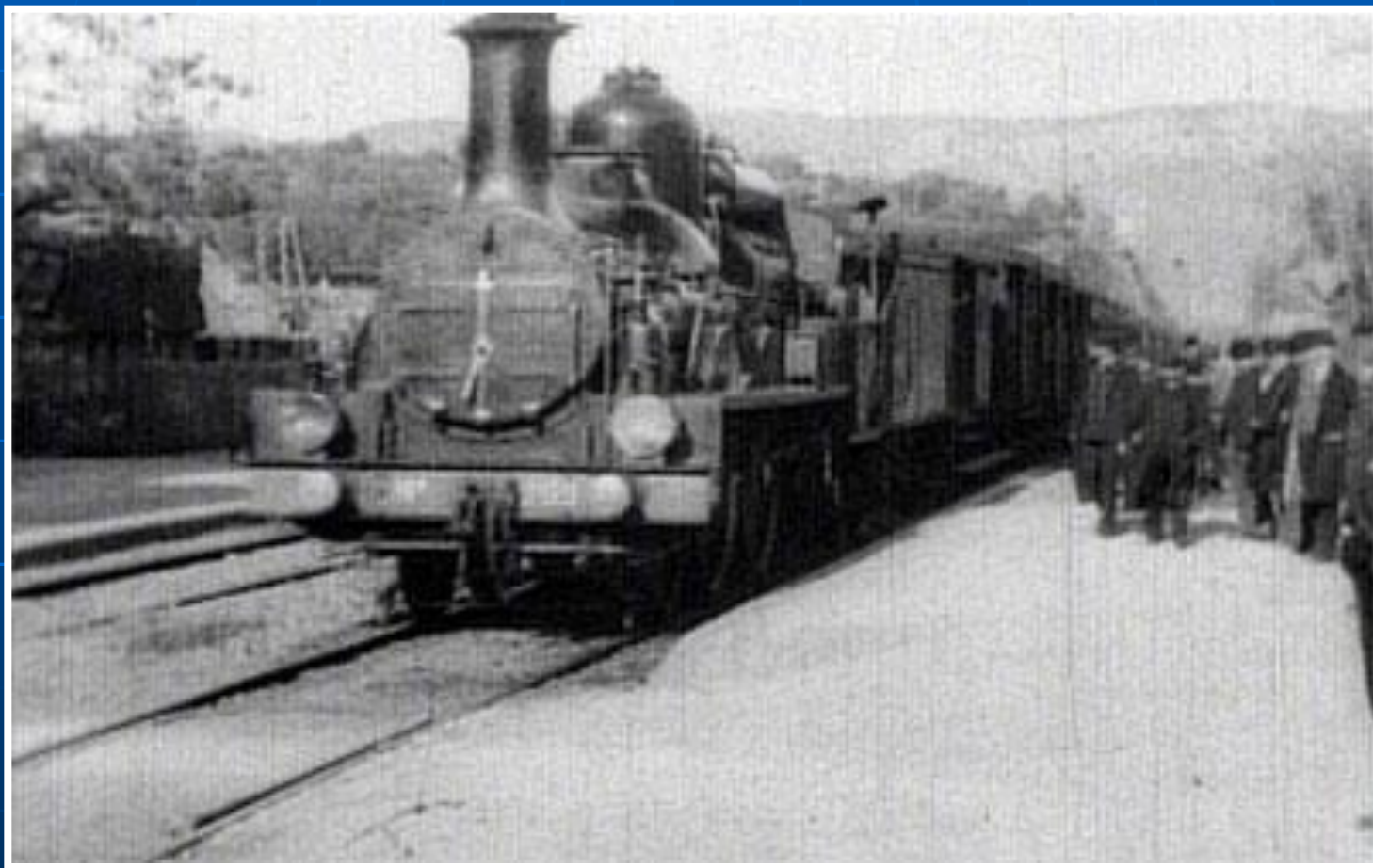
Демонстрация фильма «Прибытие поезда на вокзал Ла Сьота»