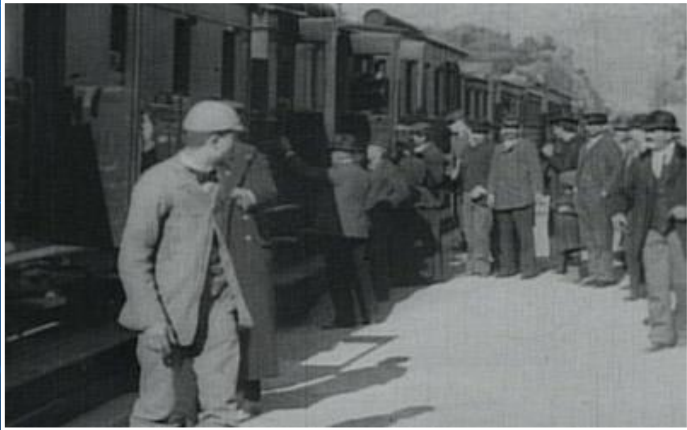
«Прибытие поезда на вокзал Ла Сьота»

Потребовалось достаточное время, чтобы понять: кино — реальность, хотя происходящее на экране фотографически похоже на действительность. Это лишь её киноизображение, новая условность экранного искусства.