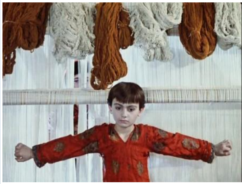
«Цвет граната» Сергей Параджанов

Цвет в кино возникает на экране без воли автора. Он копия, слепок природной реальности.