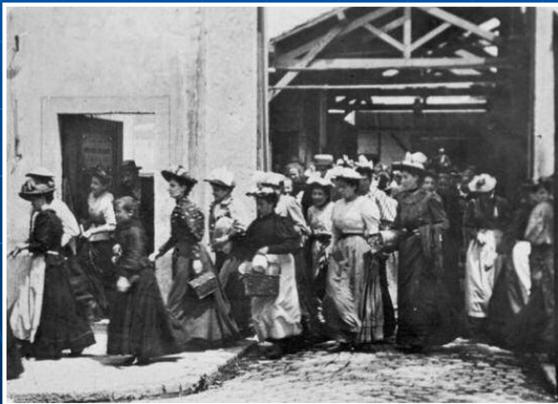
«Выход рабочих с завода Люмьер» 22 марта 1895 года

После появления фотографии для этого оставалось сделать лишь небольшой шаг: создать киноплёнку, съёмочную и проекционную киноаппаратуру и повесить экран.