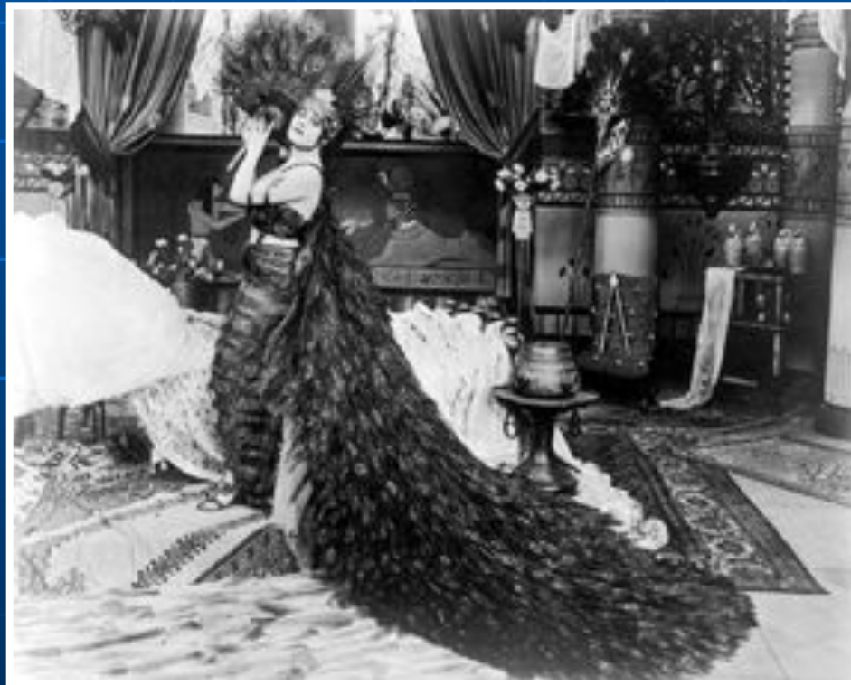
«Клеопатра» Немое кино 1917 год

Как и фотография, кино постепенно искало свой собственный язык и художественную специфику. Вначале кино, чтобы доказать свою значимость как искусства, подражало живописи, рядилось в театральные одежды. Даже само здание, где демонстрировали фильмы, называли «кинотеатр», а первый в Москве, по аналогии с Художественным театром, назвали «Художественный».