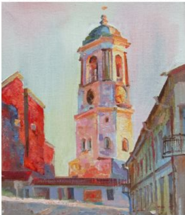
Картина Галины Буслаевой