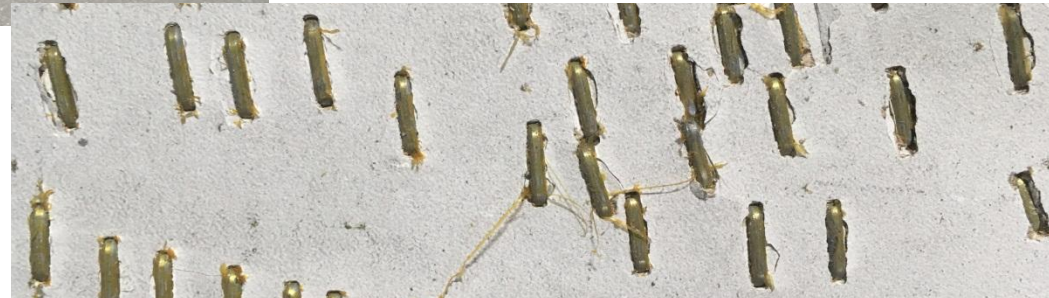
3. Скобы с шелушением по единичным ниткам (1-2 шт. в кассете).