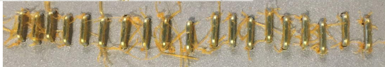
5. Скобы с сильным шелушением клея.