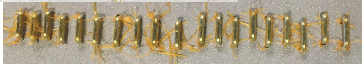
5. Скобы с сильным шелушением клея.