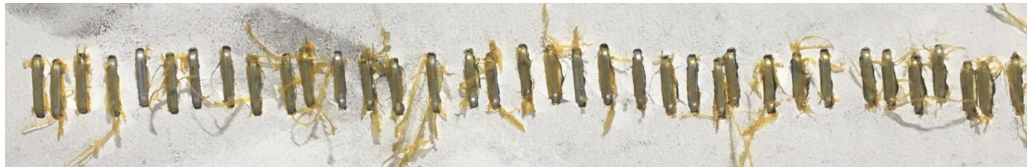
5. Скобы с сильным шелушением клея.