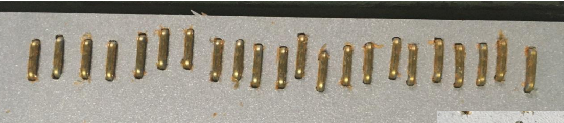
3. Скобы с шелушением по единичным ниткам (1-2 шт. в кассете).