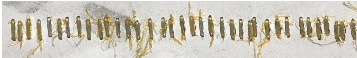
4. Скобы с шелушением клея.