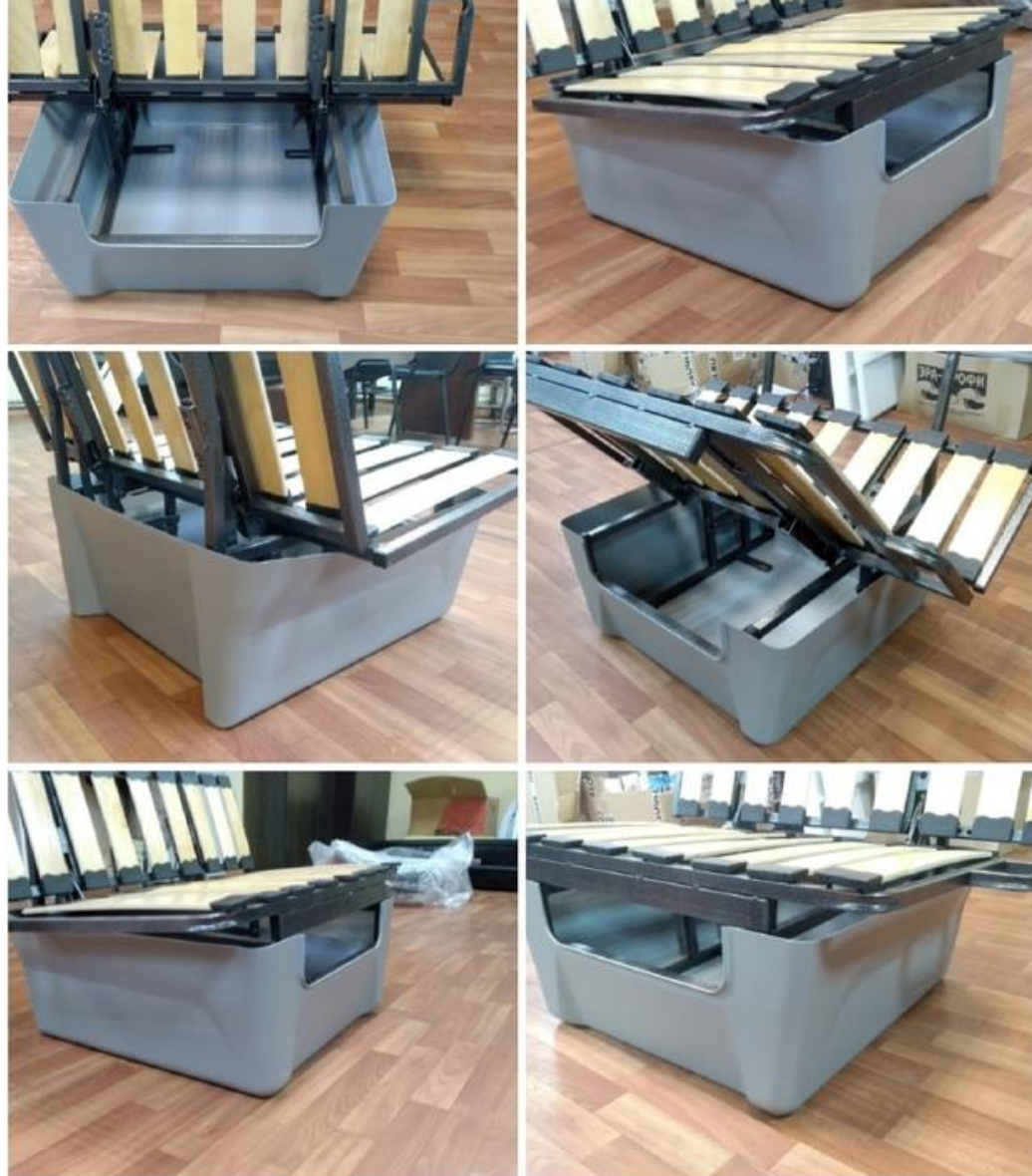
Спальник-трансформер для автомобилей семейства «ГАЗ»