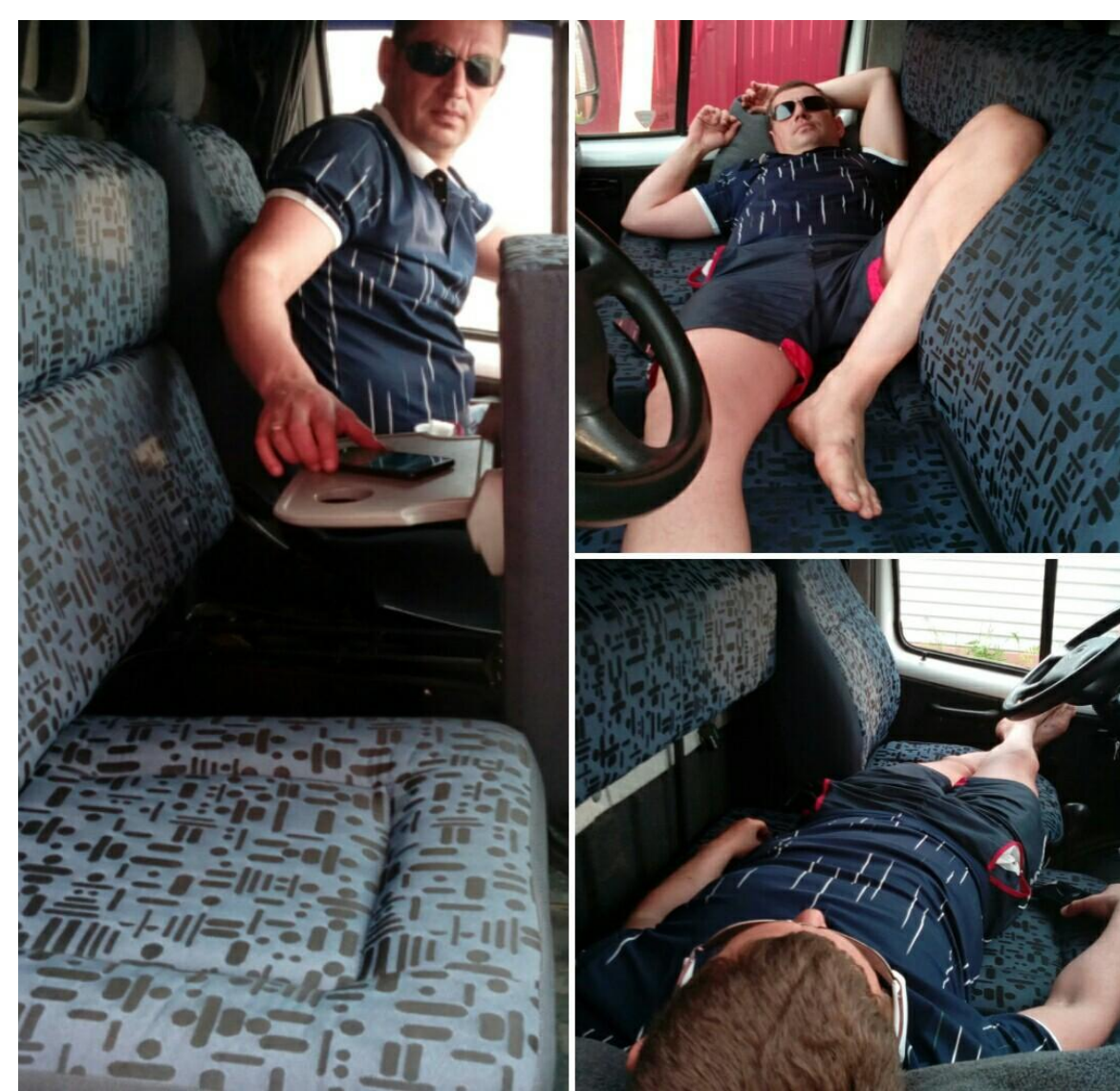
Наше кресло, с легкостью трансформирует салон автомобиля, в комфортное спальное место.