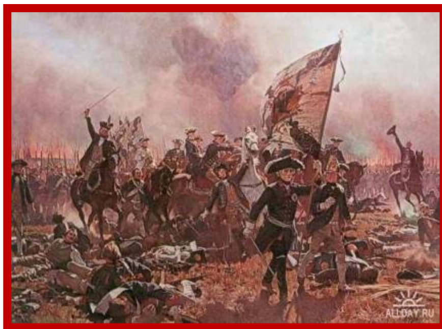
Сражение у Цорндорфа

1761 г. – смерть Елизаветы Петровны. Петр III заключил с Фридрихом II союз против своих бывших союзников и вернул Пруссии все завоевания.