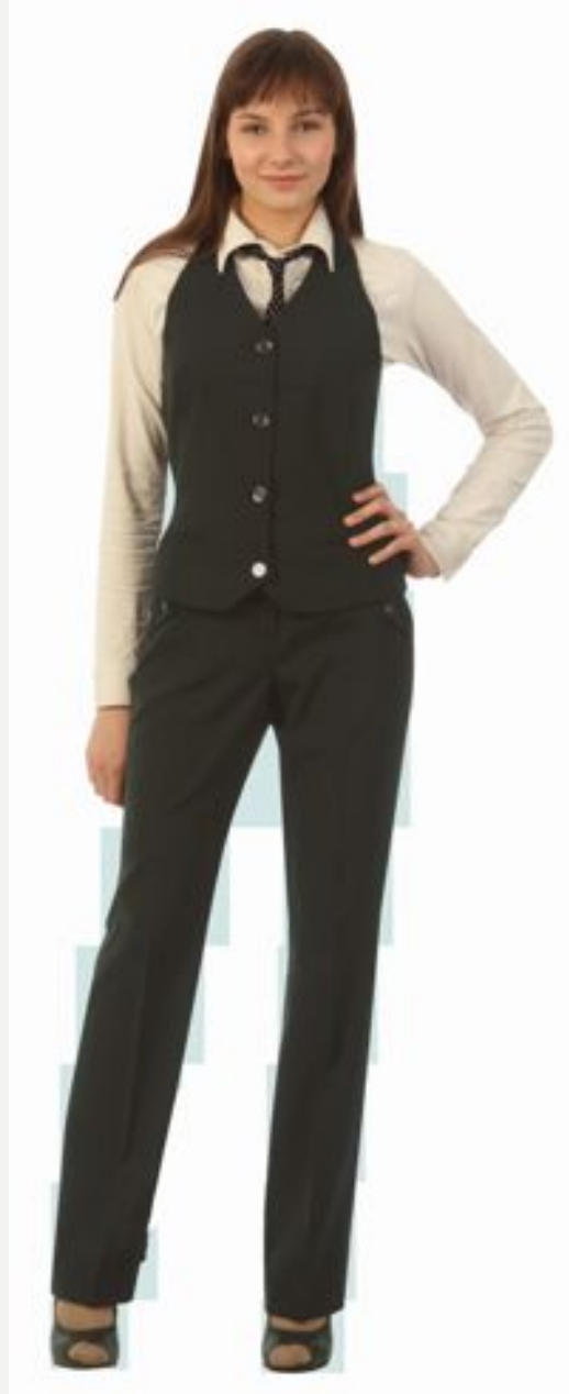
ТЕМНЫЕ БРЮКИ, РУБАШКА, ЖИЛЕТ