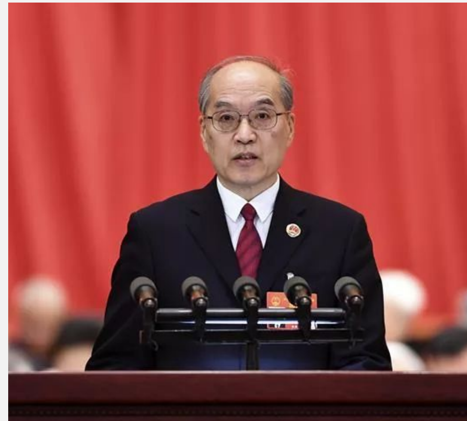
Генеральный прокурор: Чжан Цзюнь