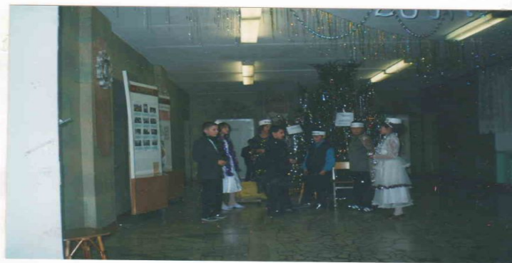
Ләбиб Леронның «Яңа ел биштәре» нән күренеш (5 нче сыйныф укучылары)