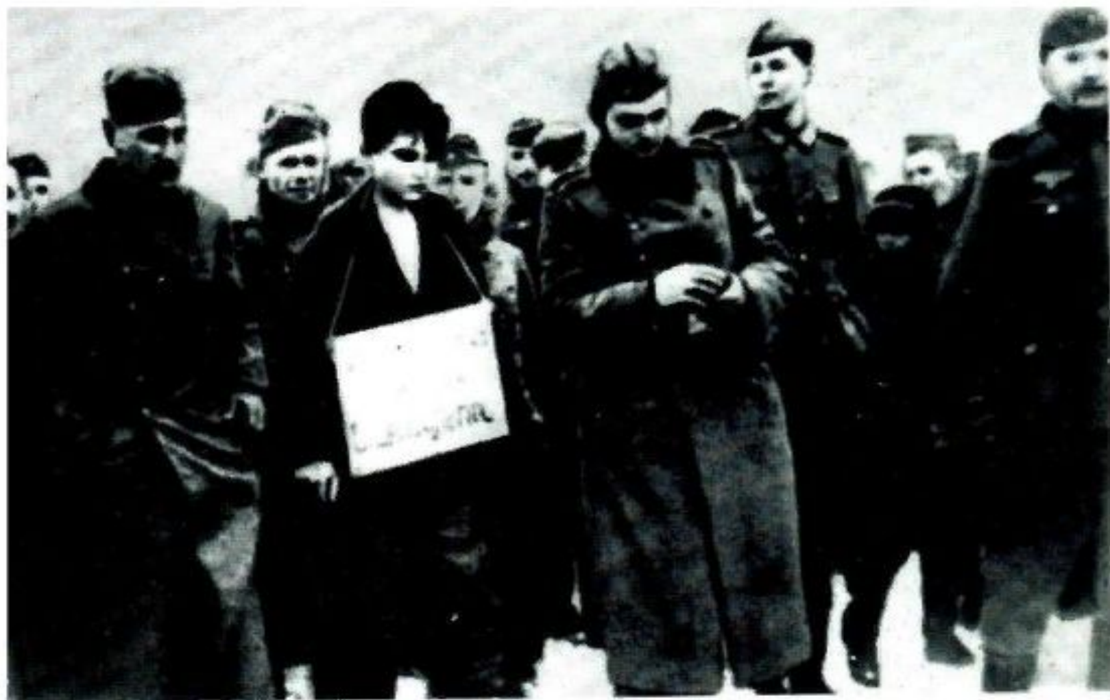
перед казнью Зои Космодемьянской