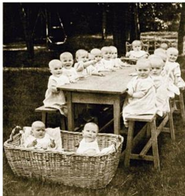
Дети в приюте Комитета великой княгини Елизаветы Федоровны. Фотография начала XX в.

В больнице обители работали лучшие специалисты Москвы. Все операции проводились бесплатно. Здесь исцелялись те, от кого отказывались другие врачи. В больнице Елизавета Федоровна брала на себя самую ответственную работу: ассистировала при операциях, делала перевязки, утешала больных и всеми силами стремилась облегчить их страдания. Ночью настоятельница молилась в молельне или церкви, ее сон редко продолжался более трех часов.