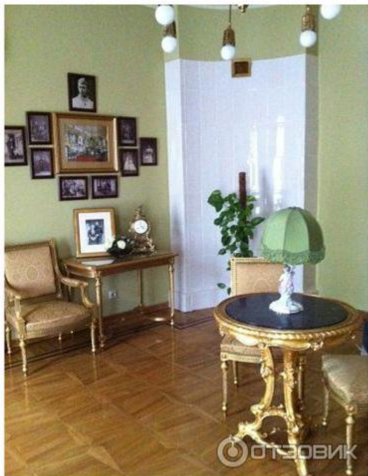
Зал, посвященный светскому периоду жизни Елизаветы Федоровны