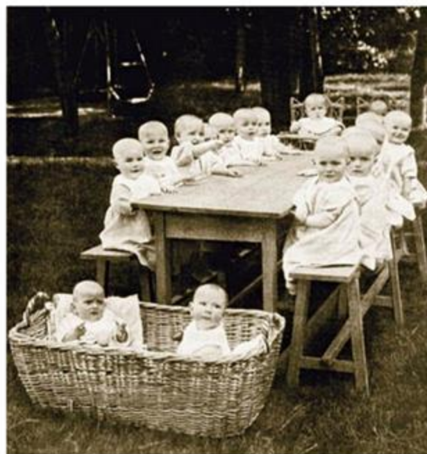
Дети в приюте Комитета великой княгини Елизаветы Федоровны. Фотография начала XX в.

В больнице обители работали лучшие специалисты Москвы. Все операции проводились бесплатно. Здесь исцелялись те, от кого отказывались другие врачи. В больнице Елизавета Федоровна брала на себя самую ответственную работу: ассистировала при операциях, делала перевязки, утешала больных и всеми силами стремилась облегчить их страдания. Ночью настоятельница молилась в молельне или церкви, ее сон редко продолжался более трех часов.