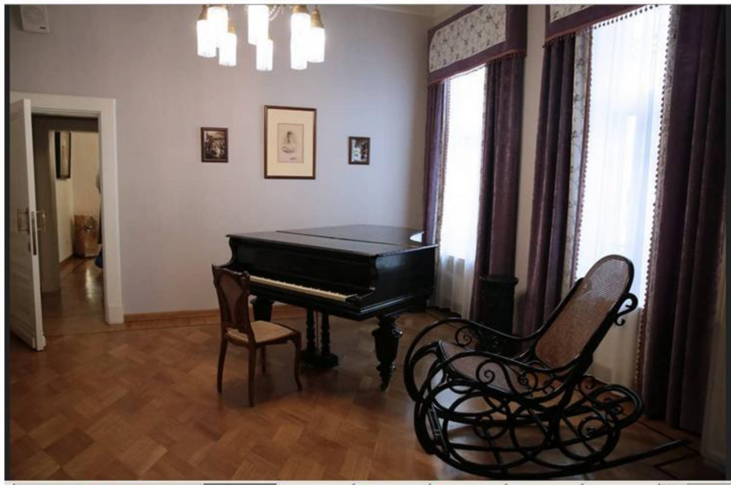
Зал с роялем

(рояль великая княгиня приобрела специально для обители, и он никогда не покидал обительские стены вплоть до наших дней)