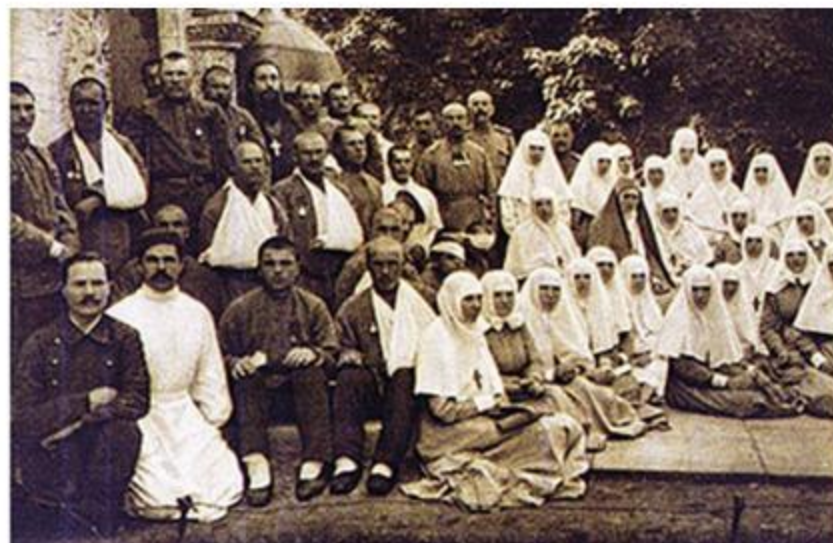
Настоятельница Марфо-Мариинской обители милосердия Великая княгиня Елизавета Федоровна с сестрами и лазаретом у северной паперти собора. 1914 г.