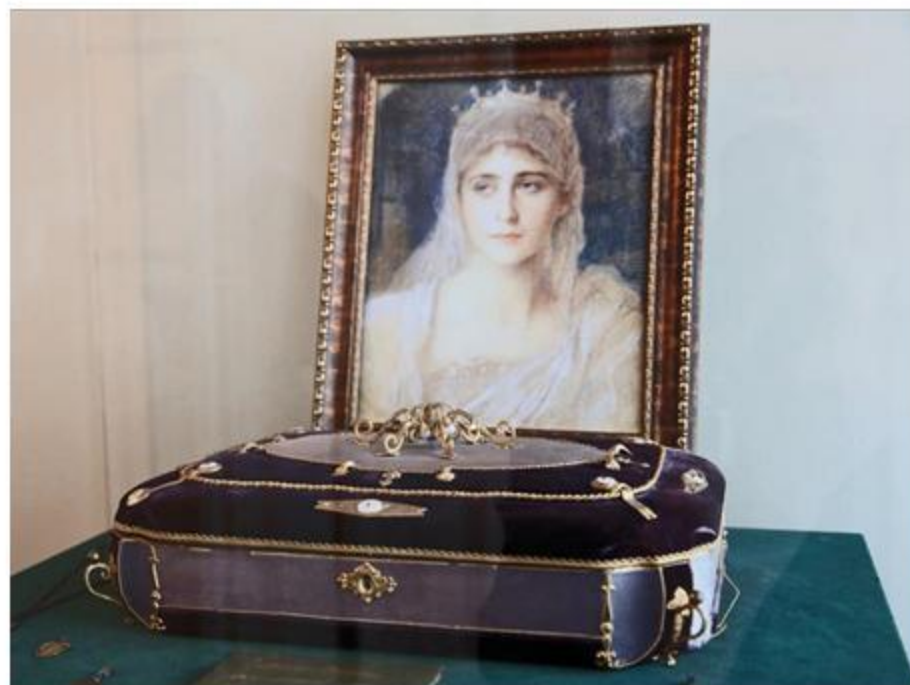
Шкатулка, подаренная Елизавете Федоровне Александром III на бракосочетание