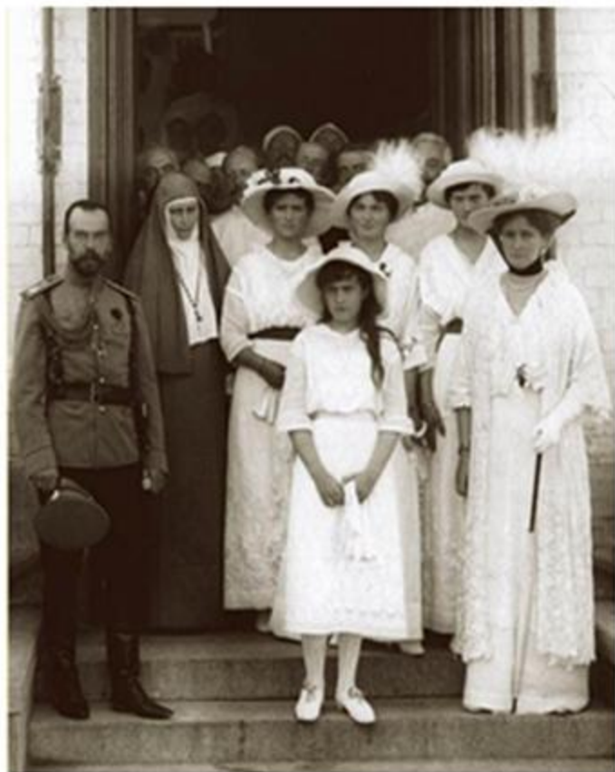
На крыльце больницы Солдатенкова (ныне Боткинской). В кругу императорской семьи. 7 августа 1914 г.