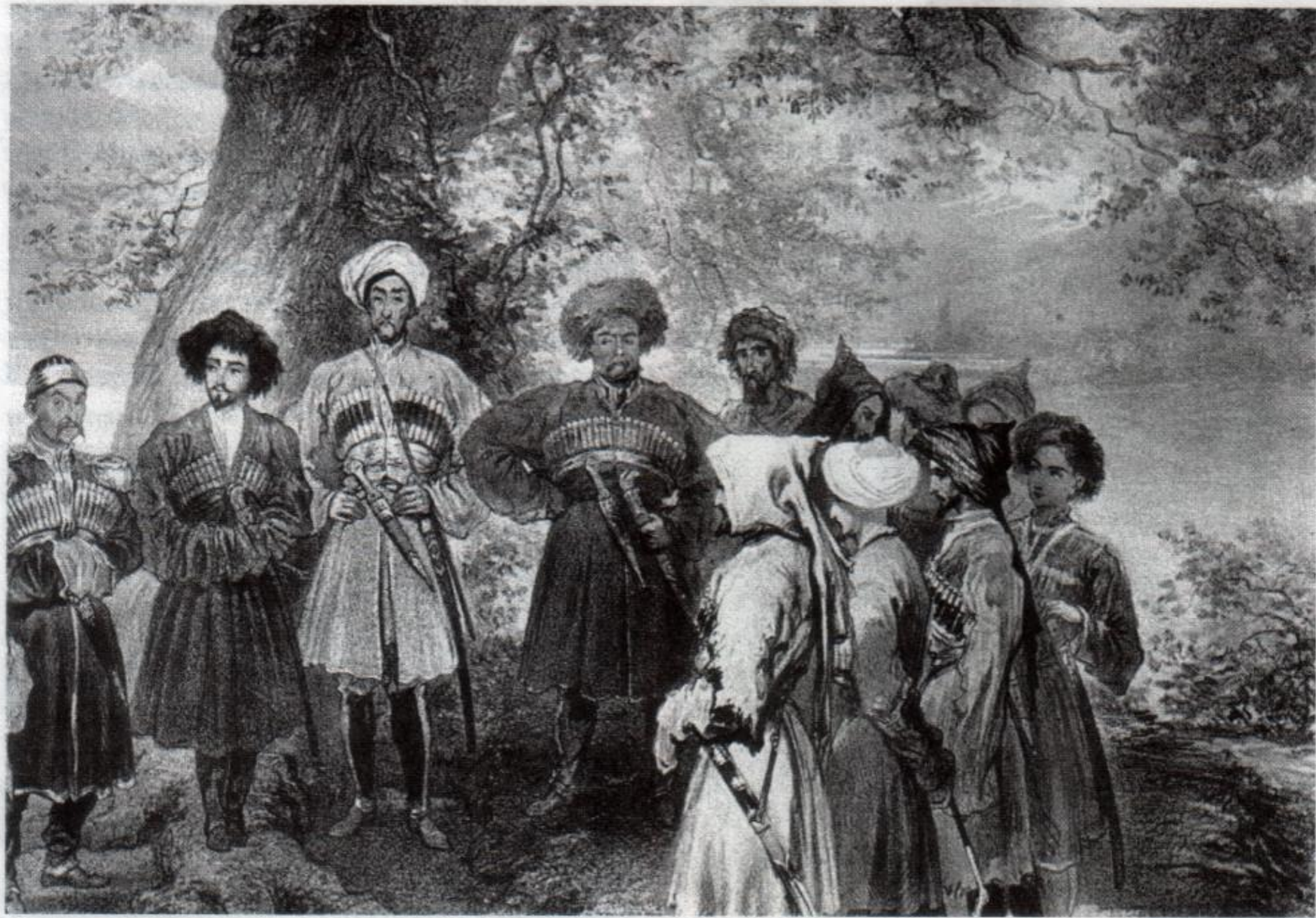
Политические и военные лидеры убыхов и абхазов. Второй слева — сочинский владетель Али Ахмет Аблагу. 1841 г. Долина реки Сочи. Художник Г.Г. Гагарин