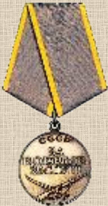
Первая медаль «За боевые заслуги»