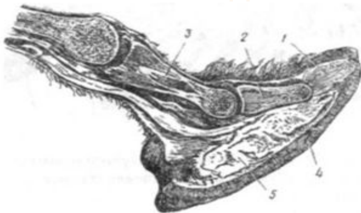
Рис. 21. Продольное сечение лапы верблюда: