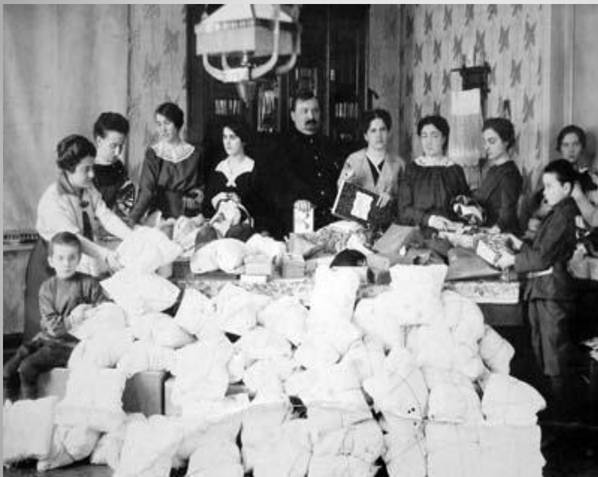
Арзамасский дамский комитет за работой.