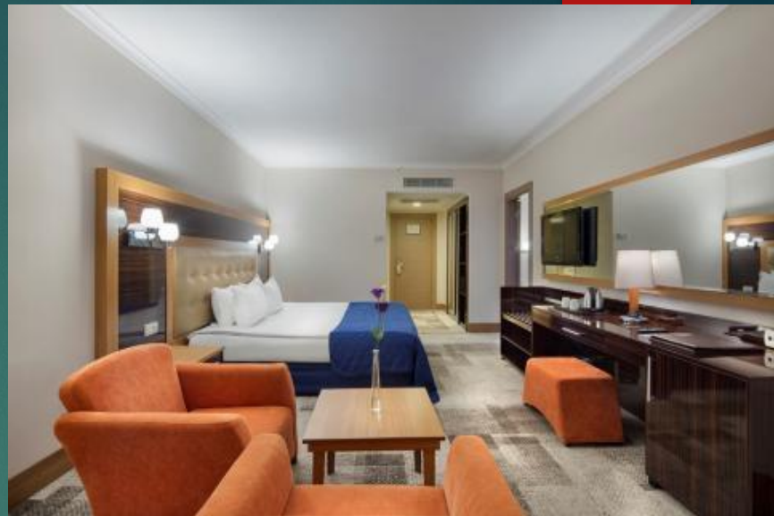
Main Building Room