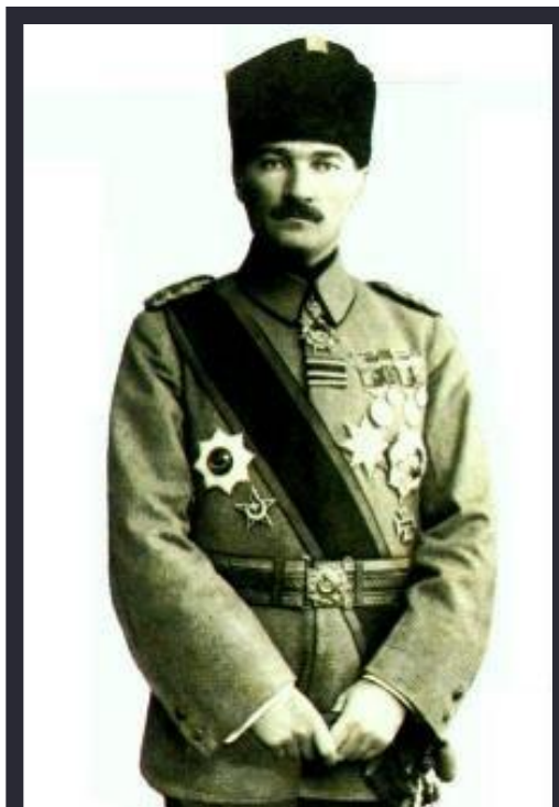
Мустафа Кемаль- Ататюрк.

В 1923 г. М. Кемаль стал президентом и пожизненным председателем правлящей партии.