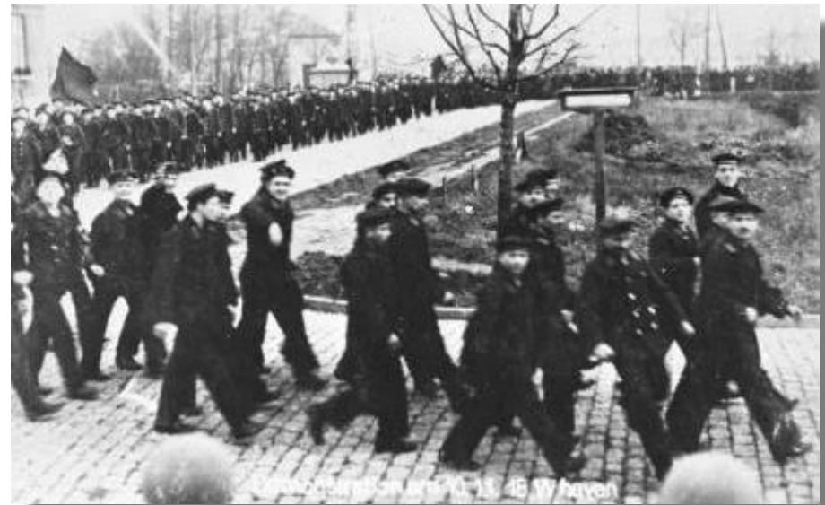
Демонстрация моряков в Киле