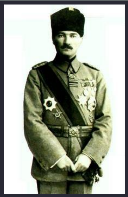
Мустафа Кемаль- Ататюрк.

В 1923 г. М. Кемаль стал президентом и пожизненным председателем правящей партии.