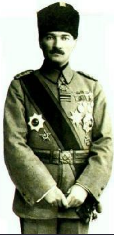
Мустафа Кемаль- Ататюрк.

В 1923 г. М. Кемаль стал президентом и пожизненным председателем правящей партии.