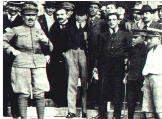
Лидеры Венгерской революции.