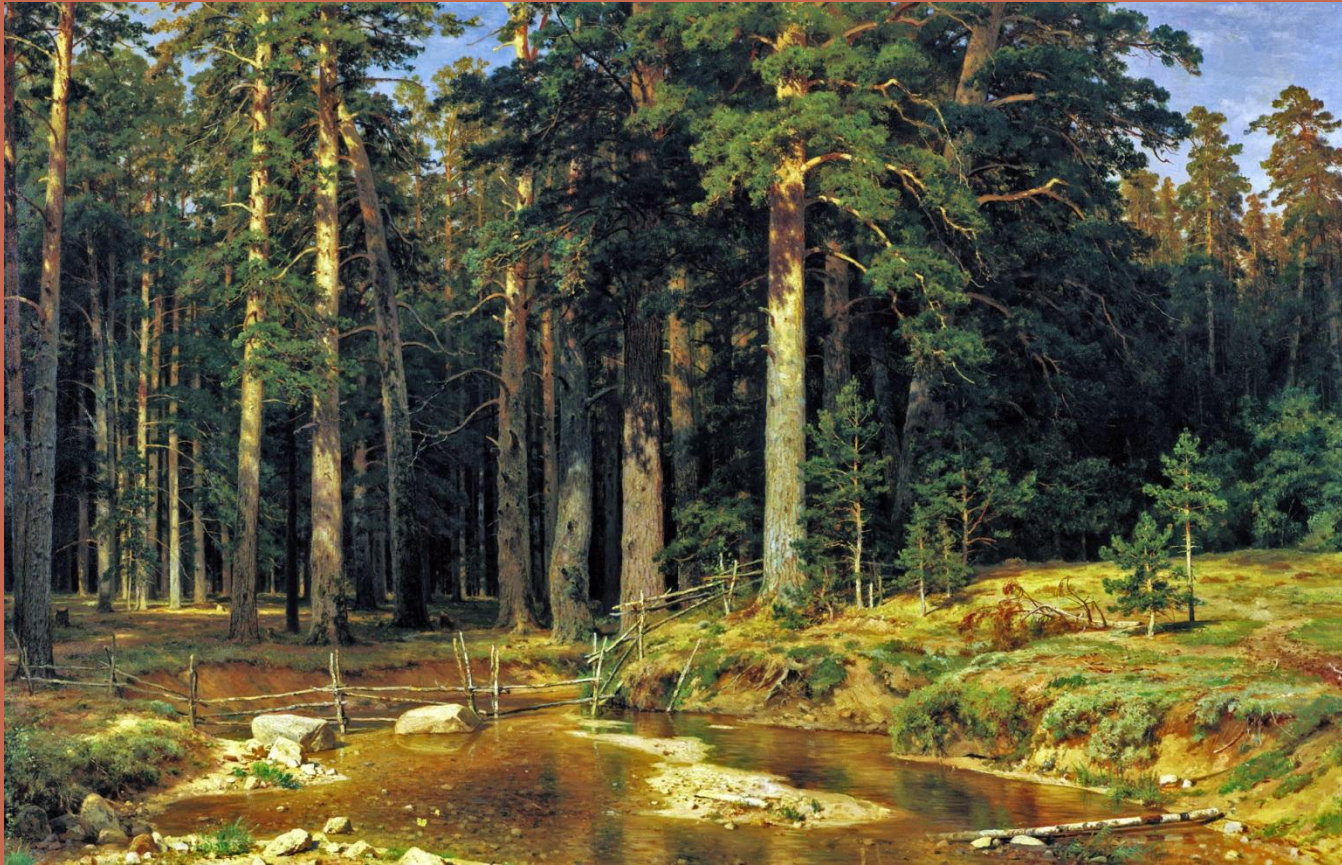
И.Шишкин «Корабельная роща»