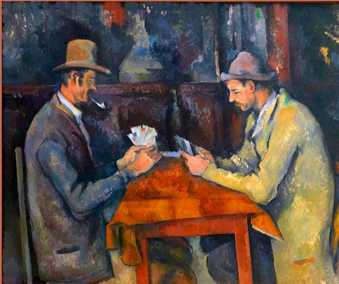
П.Сезанн «Игроки в карты»