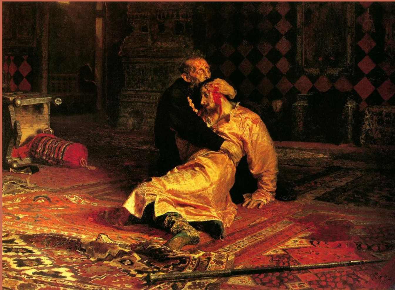
И.Репин «Иван Грозный убивает своего сына»