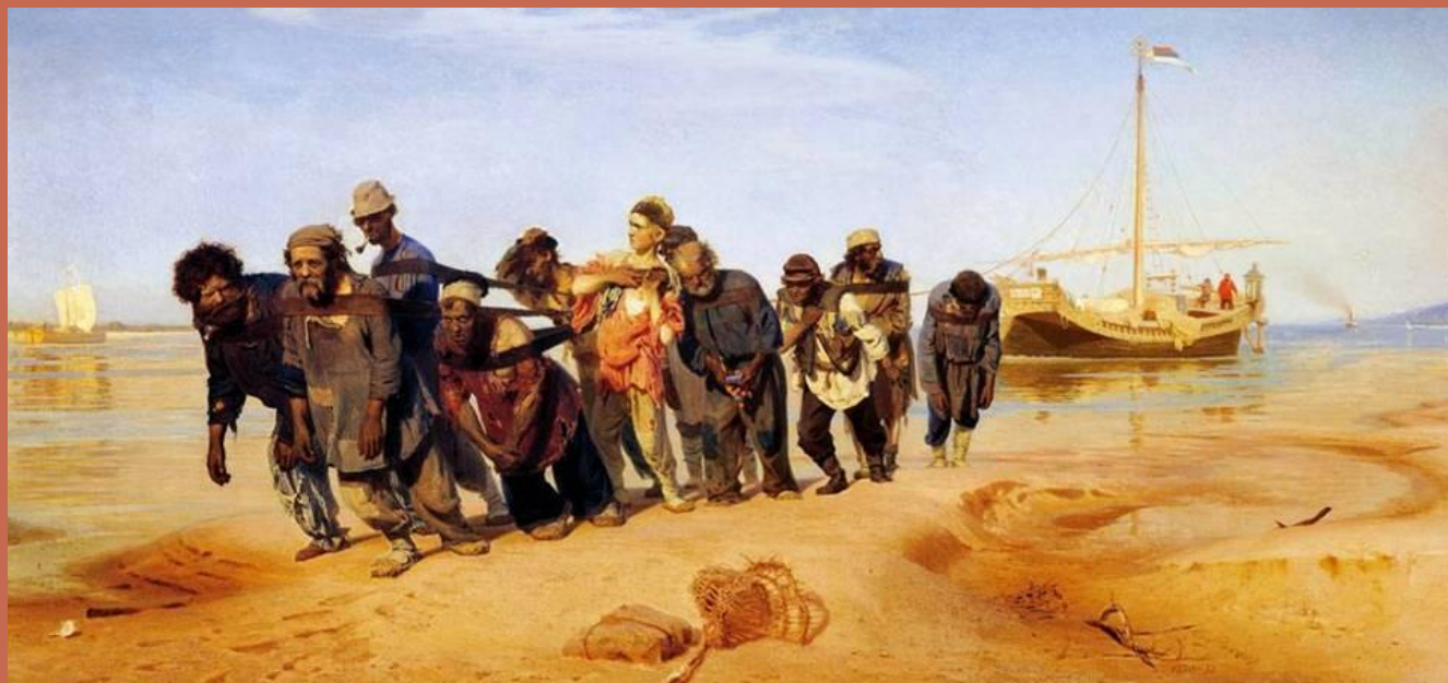
И.Репин «Бурлаки на Волге»