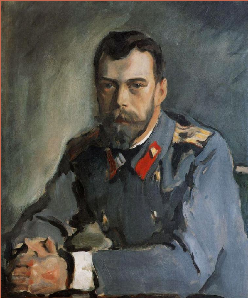
В.Серов «Портрет Николая II»