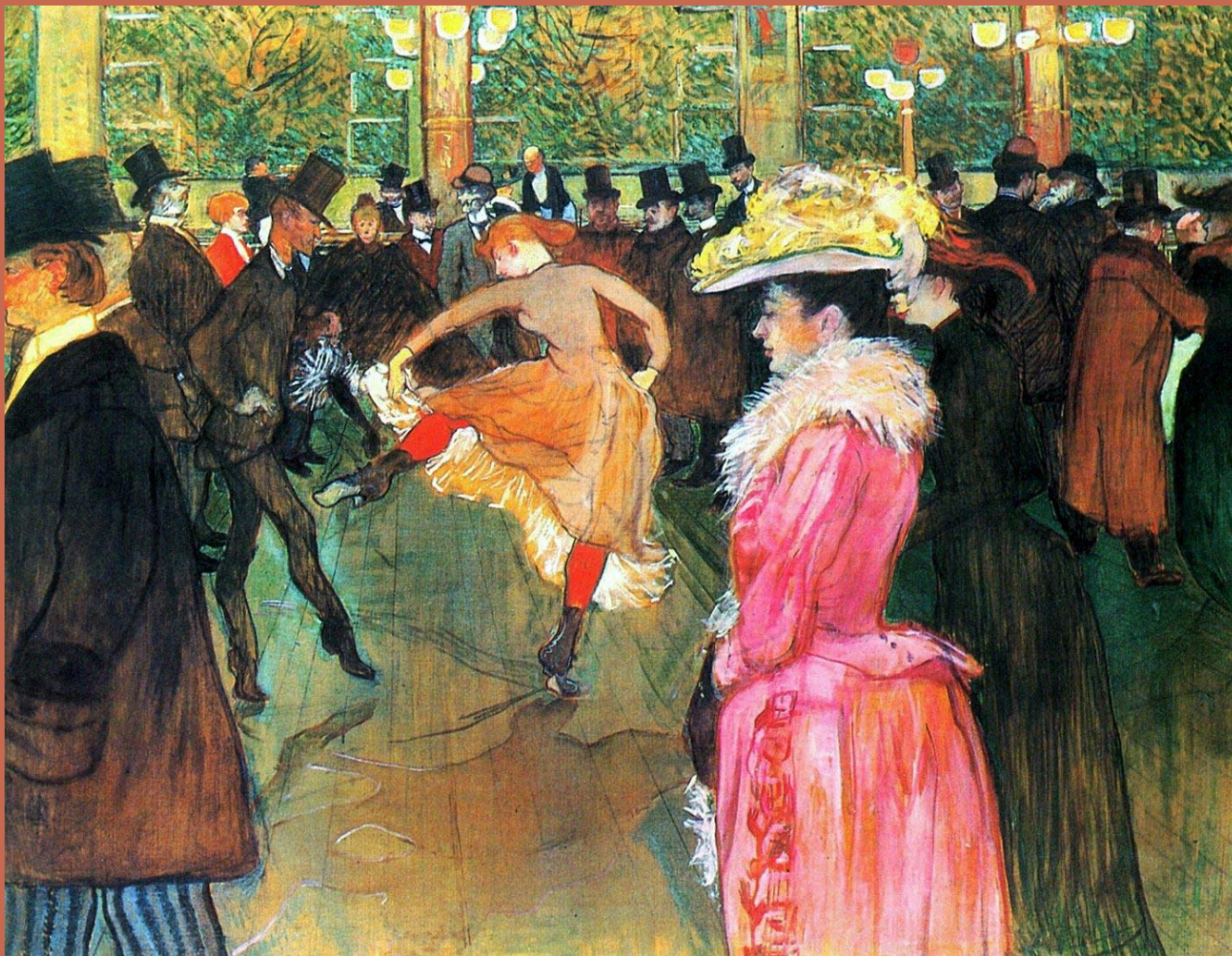
Т.Лотрек «В Мулен-Руж»