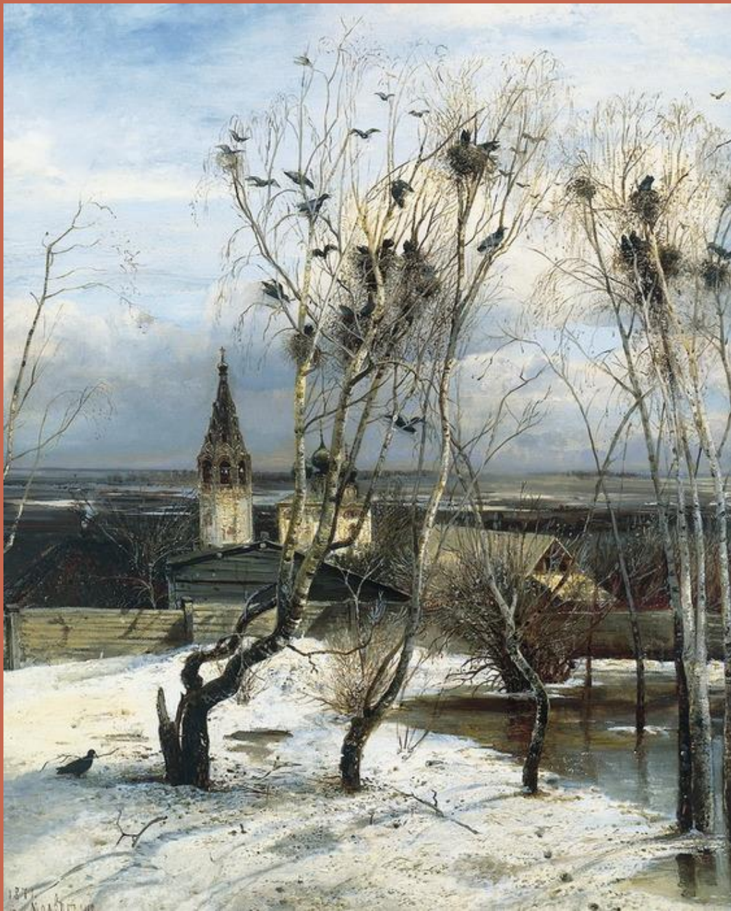
А.К.Саврасов «Грачи прилетели»