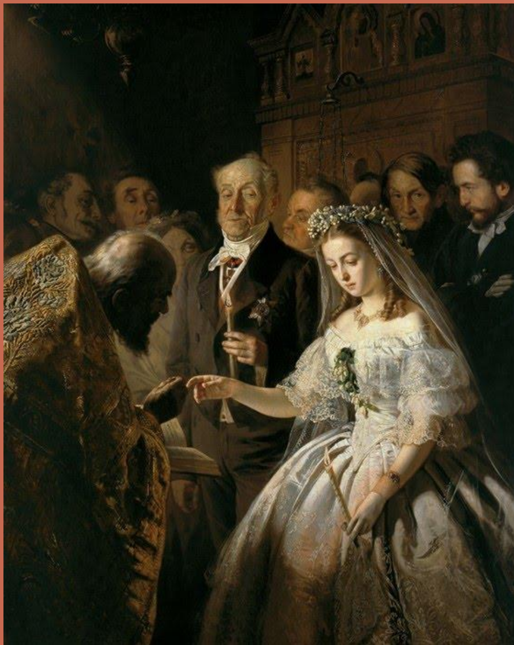
В.Пукирев «Неравный брак»