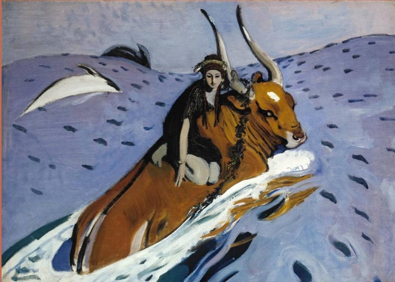
В.Серов «Похищение Европы»