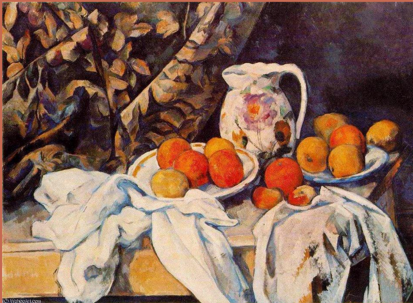
П.Сезанн «Натюрморт с яблоками и апельсинами»