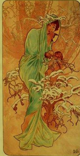
А.Муха «Четыре сезона»