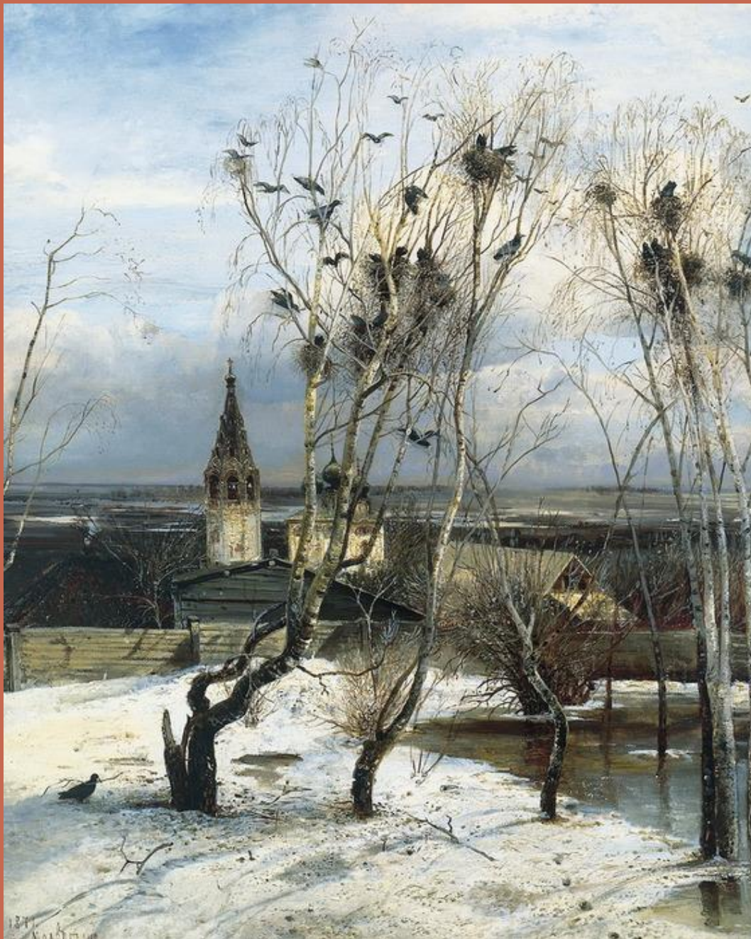
А.К.Саврасов «Грачи прилетели»