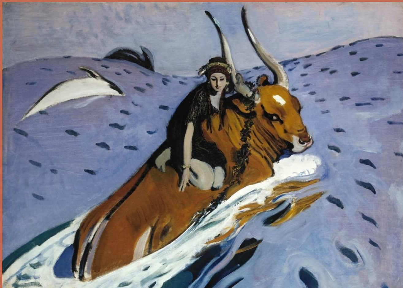
В.Серов «Похищение Европы»