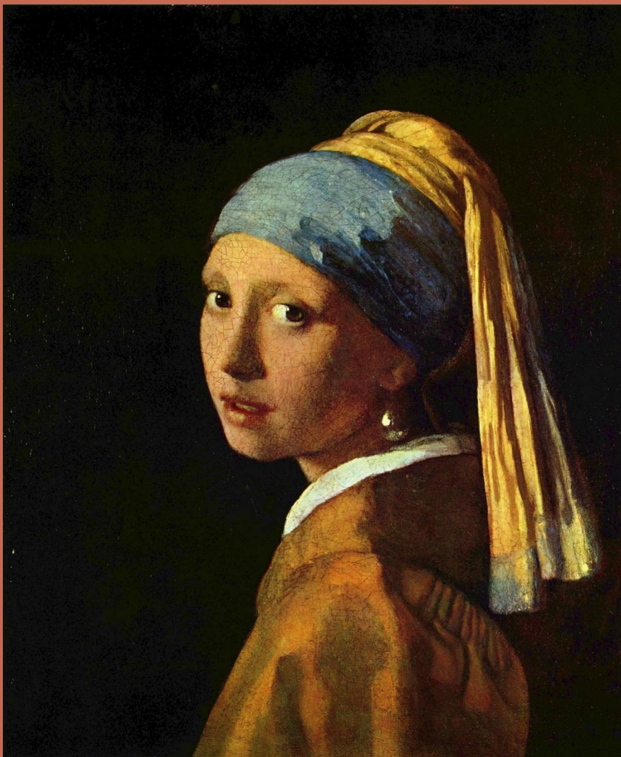
Я.Вермеер «Девушка с жемчужной серезжкой»