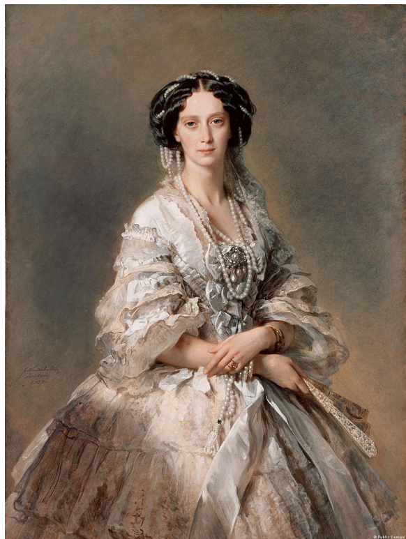
Принцесса Гессенская - императрица Мария