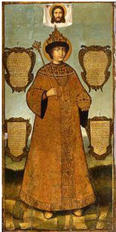
Федор Алексеевич Романов (от Милославской)