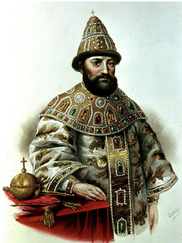
Михаил Федорович Романов