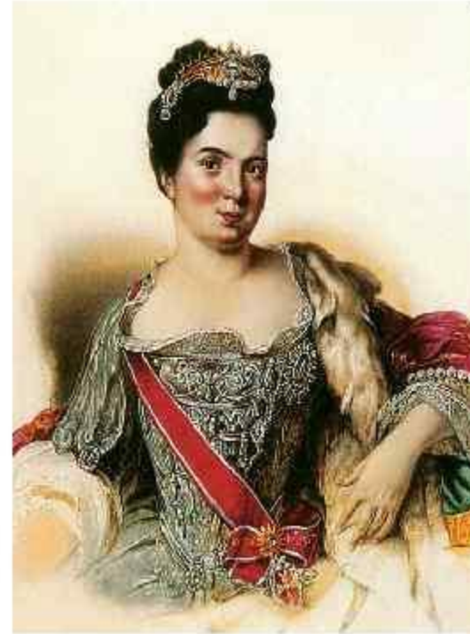
Марта Скавронская (Екатерина I Алексеевна)