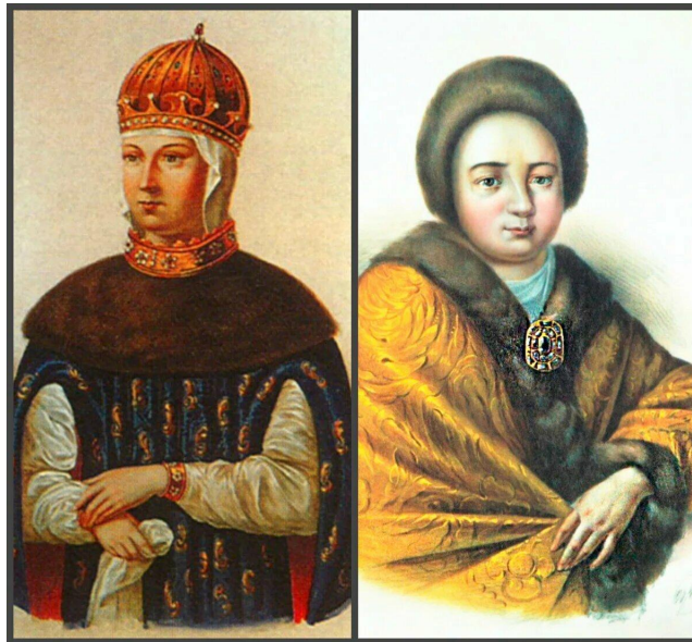
Милославская 1 жена жена