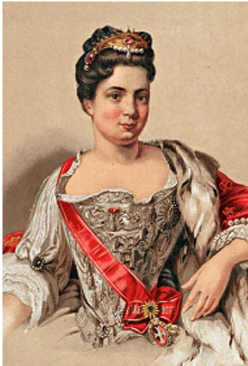
Екатерина I 1725-1727