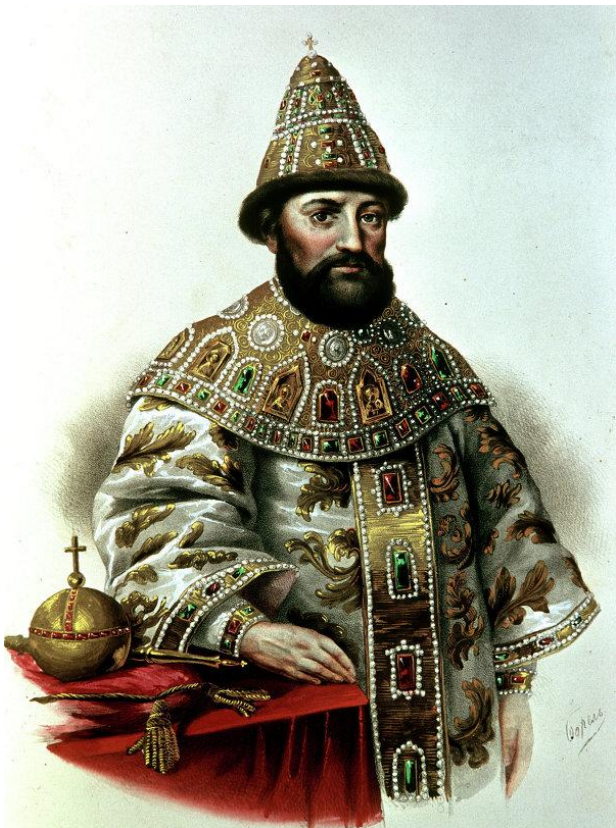
Михаил Федорович Романов