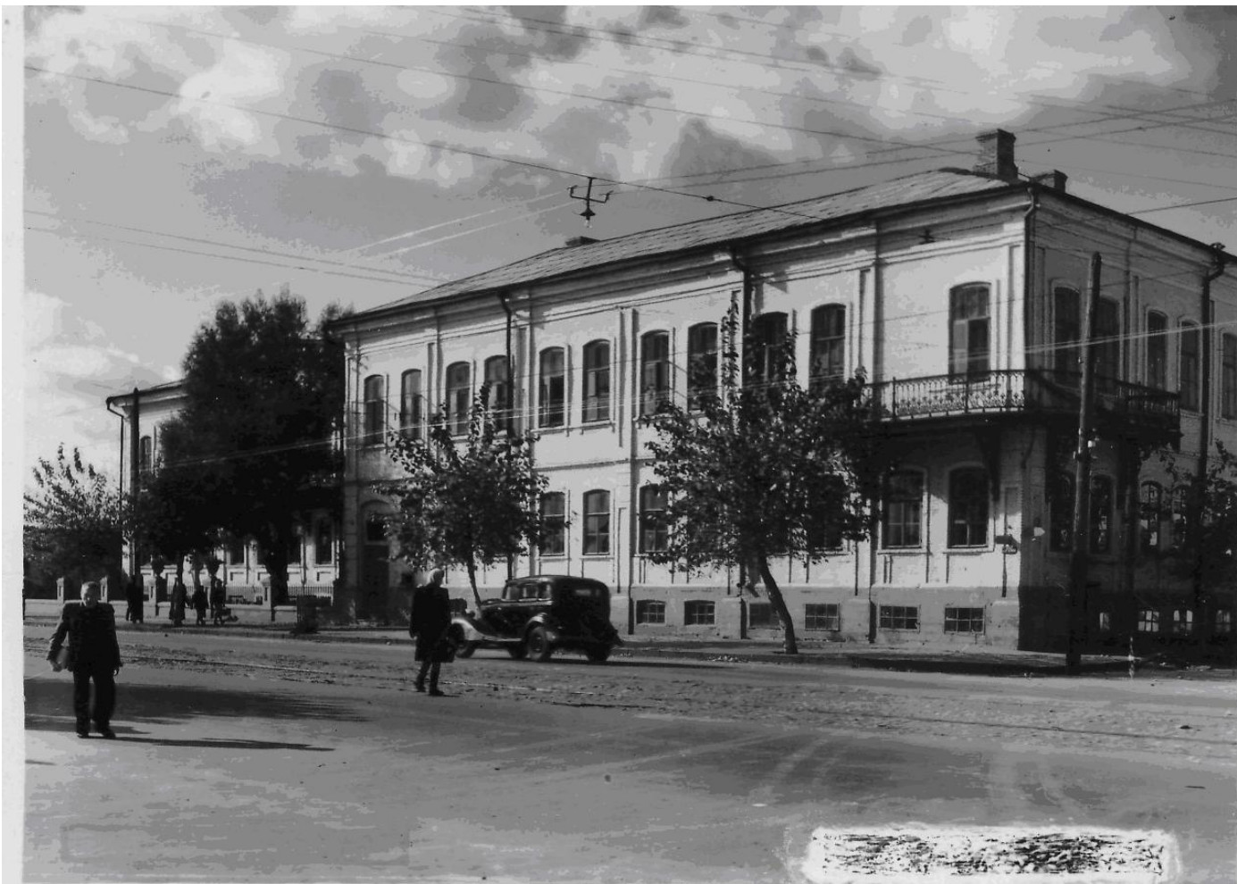
г. Орел. Пединститут.