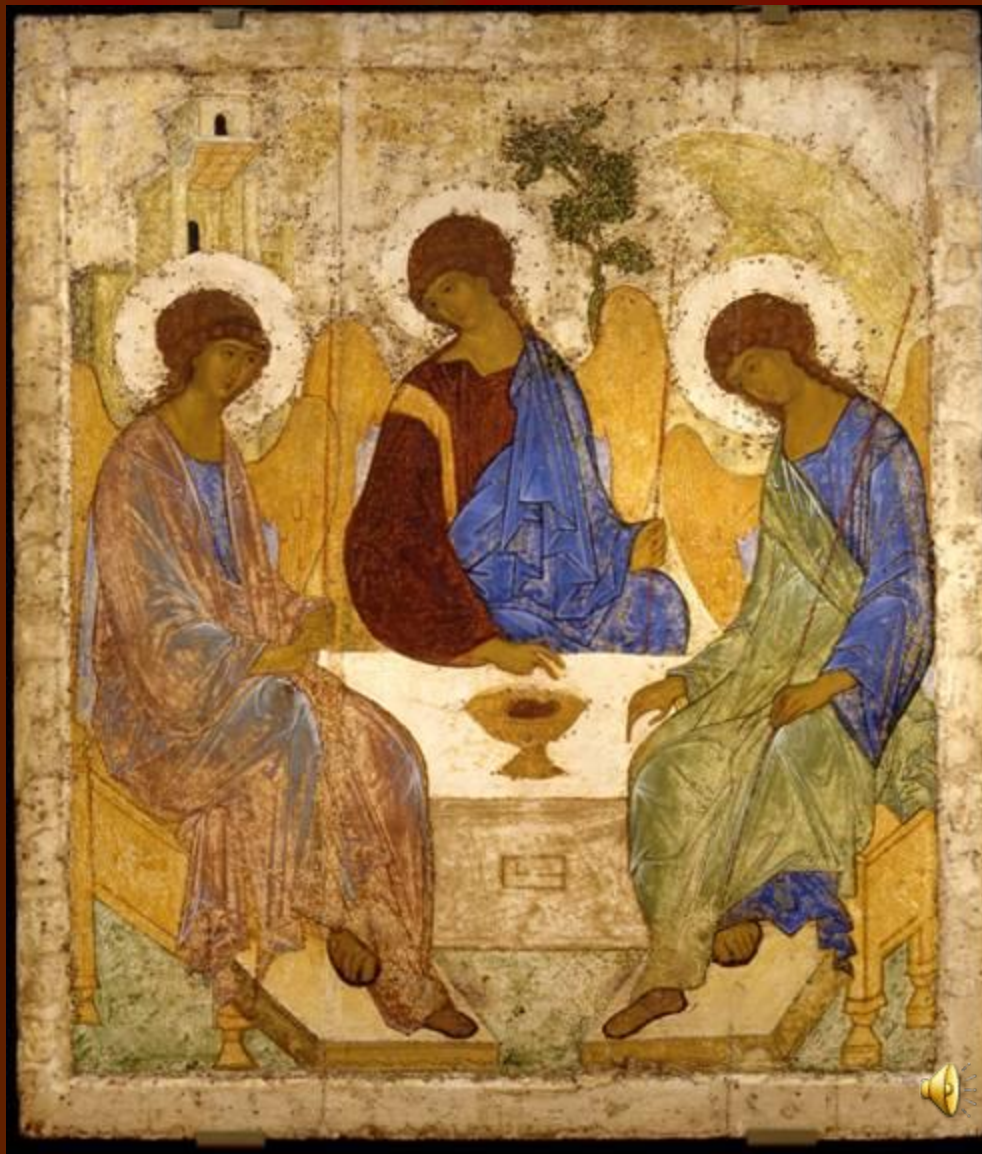
Андрей Рублев. Троица ветхозаветная