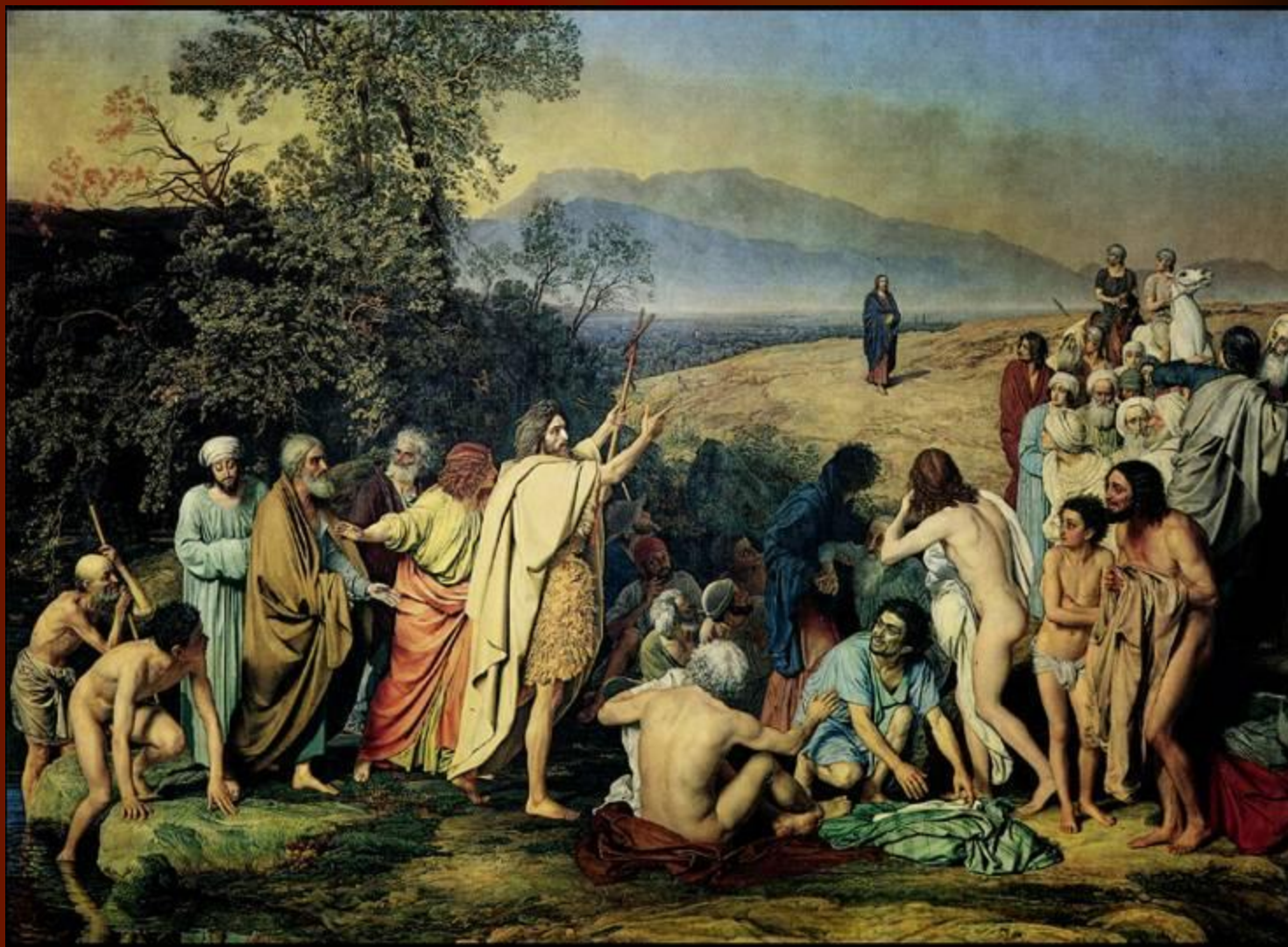
А.А.Иванов. Явление Христа народу