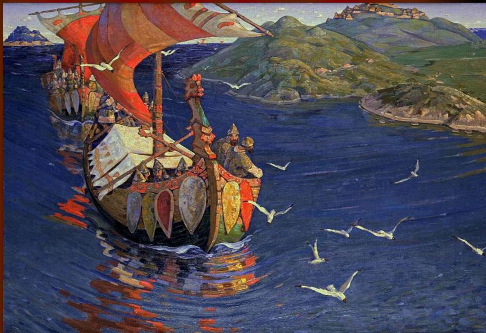
Н.К.Рерих. Заморские гости