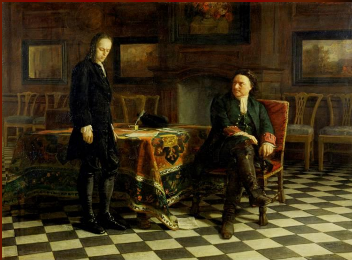
Н.Н.Ге. Пётр I допрашивает царевича Алексея Петровича в Петергофе.