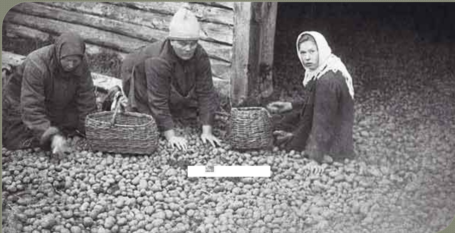
В селе Усолъе под Переславлем-Залесским, где он жил в 1941-1943 годах.