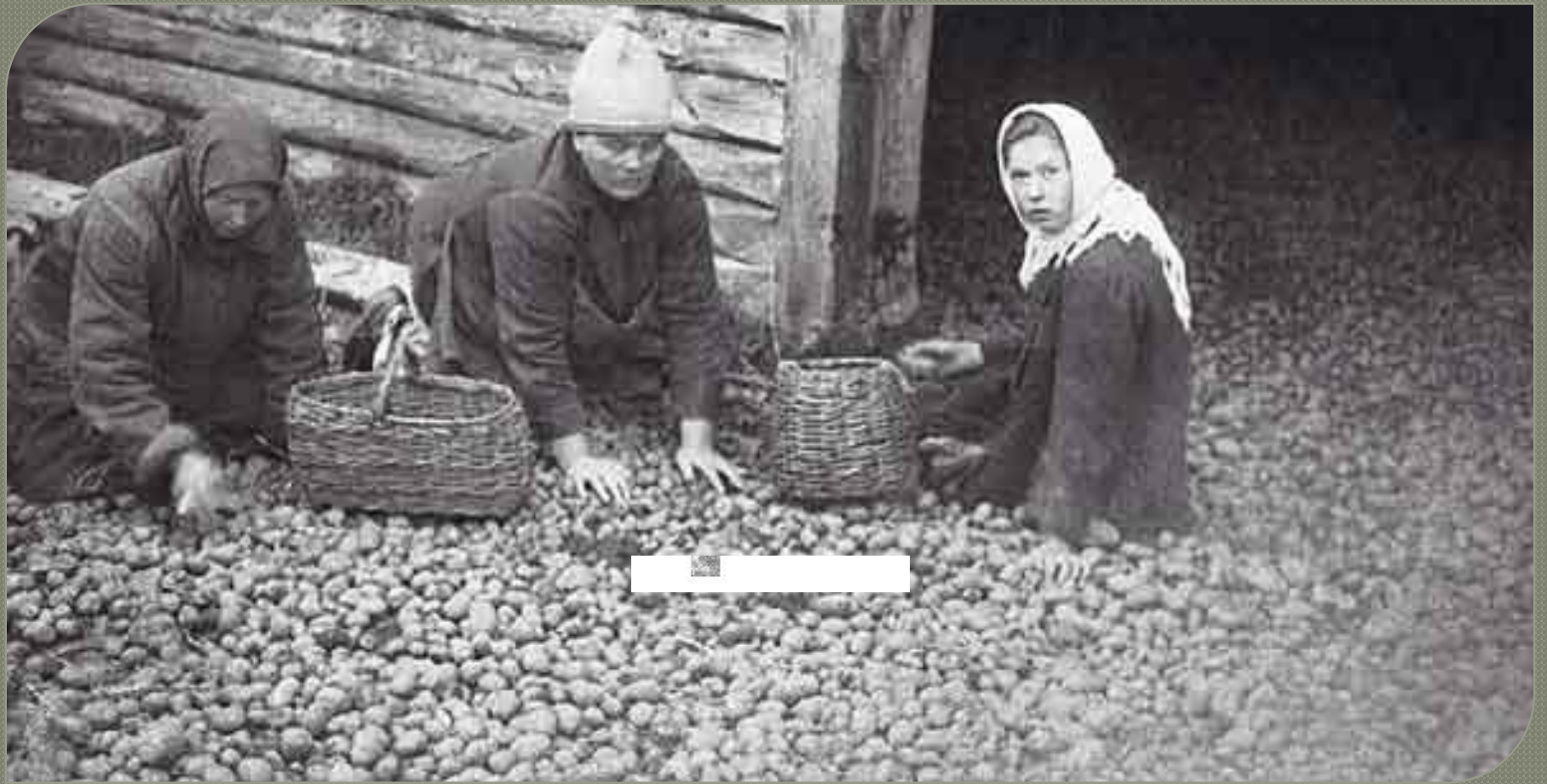
В селе Усолъе под Переславлем-Залесским, где он жил в 1941-1943 годах.