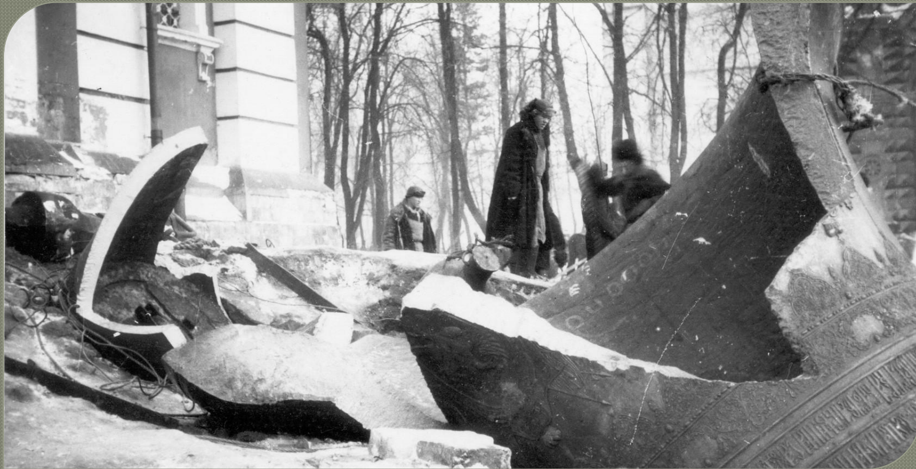
Сброшенные колокола в Сергиевом посаде.