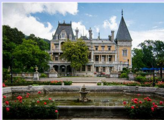
Дворец княгини Гагариной