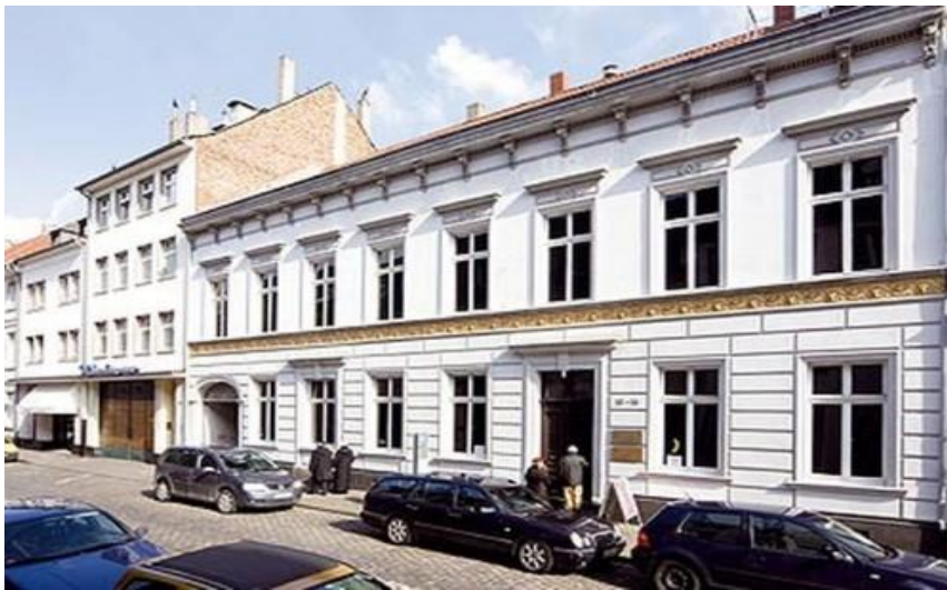
Музей Генриха Гейне (Heinrich-Heine-Institut)

На Болькерштрассе (Volkerstrasse), среди баров и ресторанов, находится дом, в котором родился знаменитый писатель и поэт Гейнрих Гейне (Heinrich Heine 1797-1856). «Дюссельдорф прекрасен» (Dusseldorf ist sehr schön), — сказал когда-то великий писатель. В его доме находится литературное бюро и кафе «Schnabelewopski», где проходят постоянные встречи с писателями.