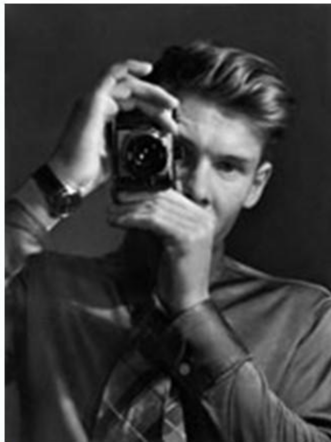
Пер-Улоф Янсон фотограф