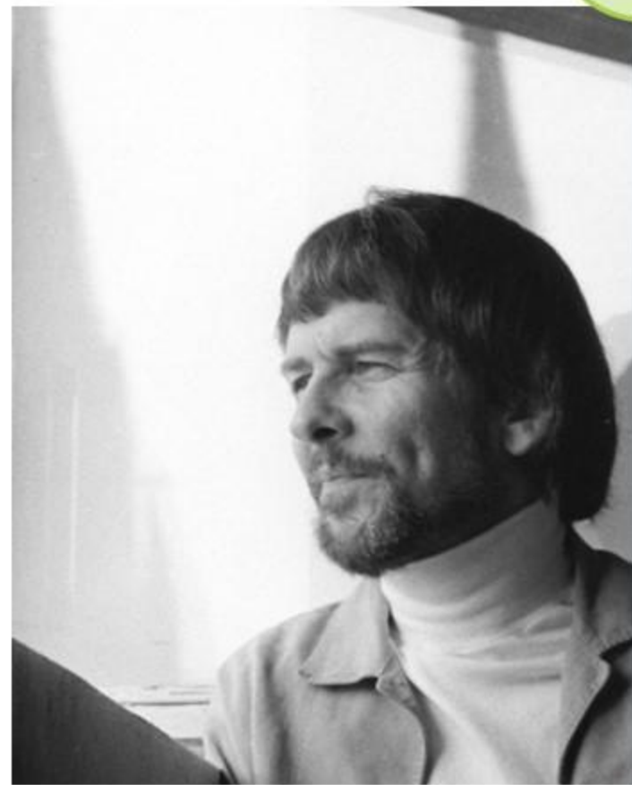
Ларс Янсон художник