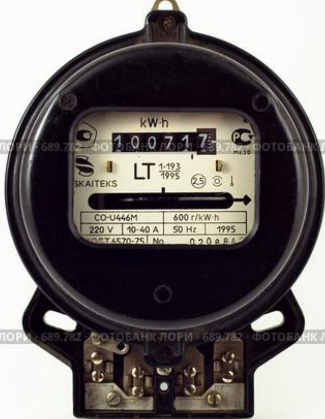
Электросчетчик индукционный СО-И446М