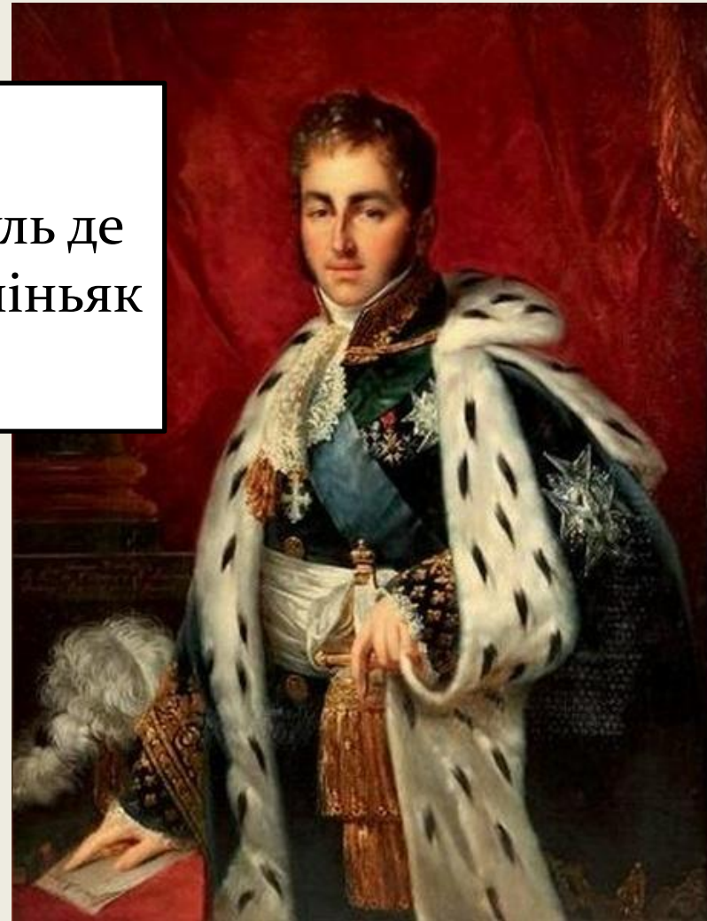
Жуль де Поліньяк