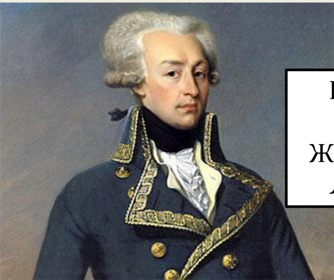
Генерал маркіз Жільбер де Лафает.

Таємні антимонархічні “Товариства карбонаріїв”, метою яких було усунення від влади Бурбонів.