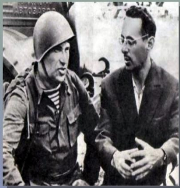
Исполнитель песни «Тёмная ночь» Марк Бернес (слева) и Юрий Левитан на съемках фильма «Два бойца»

В фильме «Два бойца» песня «Темная ночь» звучала голосом Марка Бернеса из уст главного героя фильма Аркадия Дзюбина.