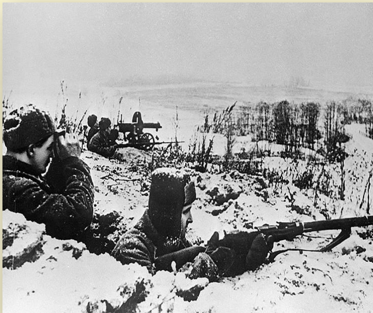
Битва под Москвой

Одна из самых знаменитых песен Великой Отечественной войны «Священная война» - своеобразный гимн-плач народа, ввязанного в войну и вынужденного защищать свою Родину от врага, была написана в самом начале войны.