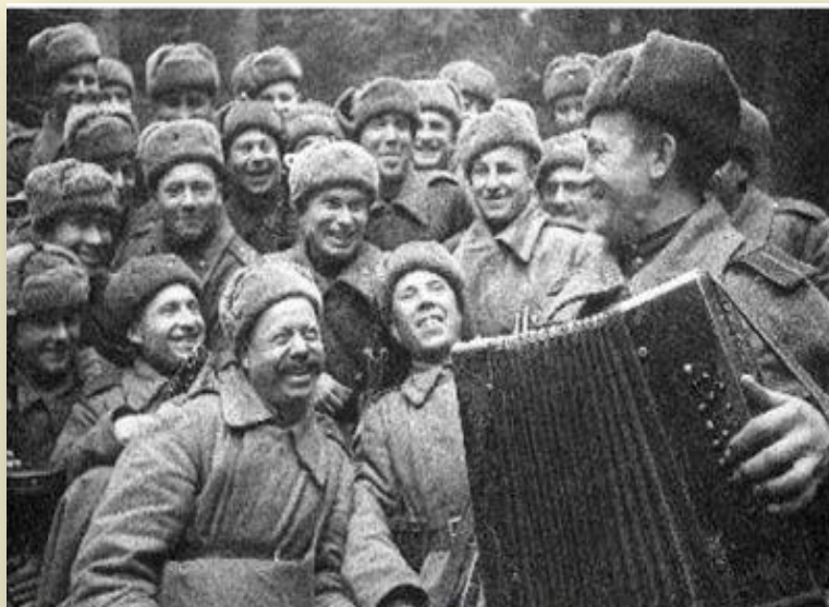
Владимир Трошин «В землянке».

Одна из самых первых лирических песен военных лет, «В землянке» , «родилась» совершенно случайно.