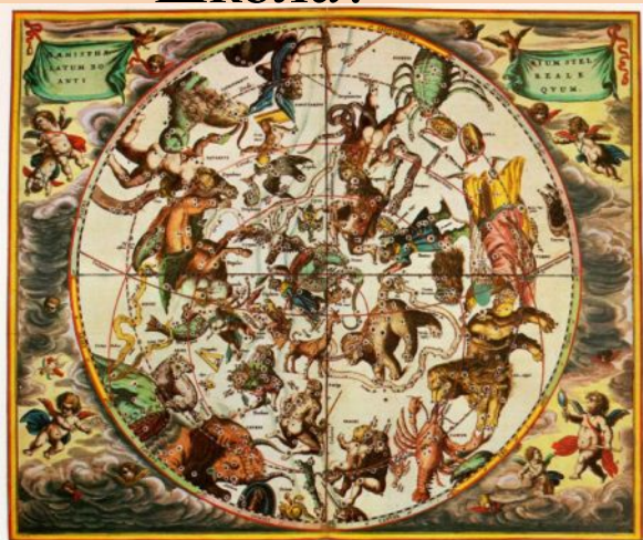
Part of a chart of the ... Beyond about 30° the angles become too small to ... ions. It was noticed that a fan of the helixes etc.

В каком году была составлена карта звёздного неба, открыт военный госпиталь и первая медицинская школа?