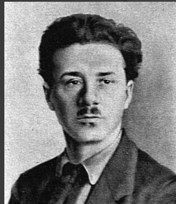
Шумяцкий Борис Захарович