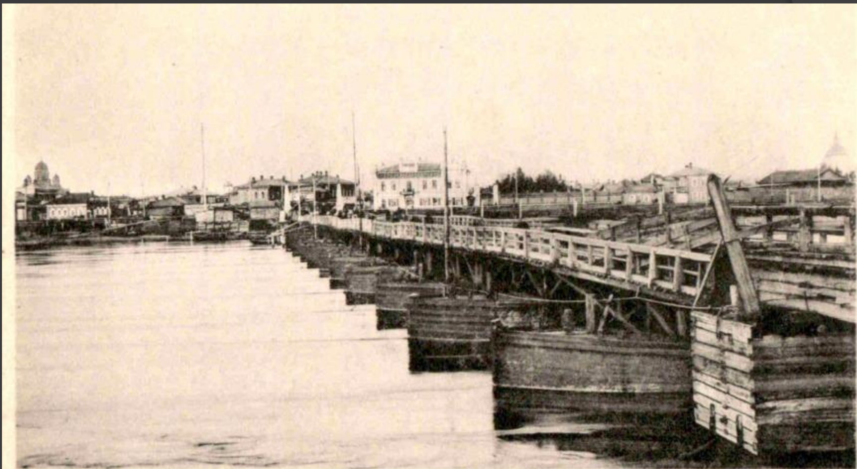
Иркутскъ. Понтонный мостъ р. Ангары.