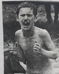
Георгий Ильин во время теракта. С этой известной фотографии был сделан памятник в Сан-Марино.