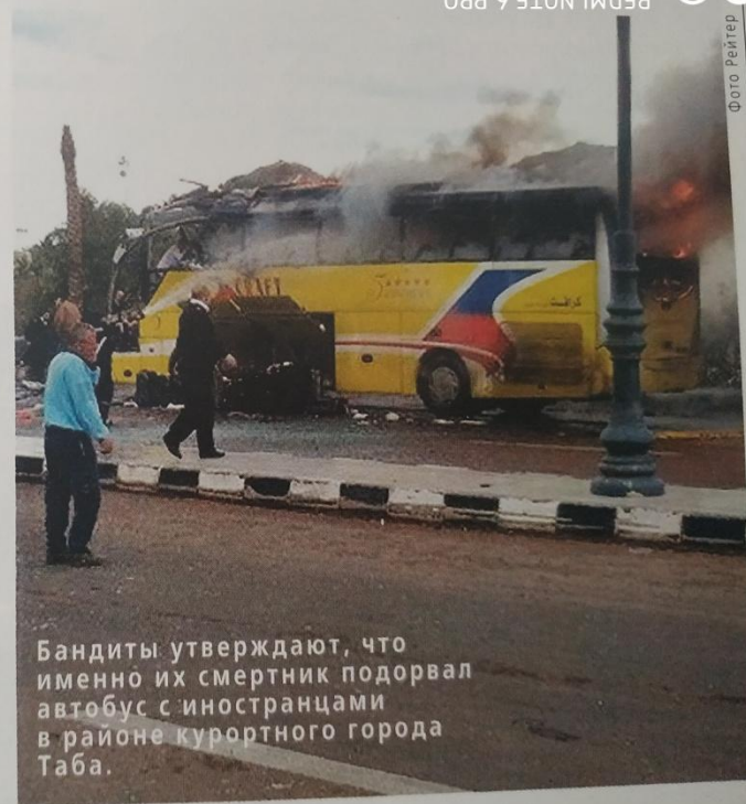
Бандиты утверждают, что именно их смертник подорвал автобус с иностранцами в районе курортного города Таба.

Связанная с «Аль-Каидой» египетская исламистская группировка «Ансар Бейт аль-Макдис» потребовала от туристов в срочном порядке покинуть страну. Бандиты утверждают, что именно их смертник подорвал автобус с иностранцами в районе курортного города Таба, в результате взрыва погибли три гражданина Южной Кореи и водитель-египтянин. «Мы предупреждали, — заявили террористы, — что грядут дни, которые принесут ещё больше горя. У туристов есть время, чтобы уехать из Египта. В противном случае им будет некого винить, кроме себя». ■