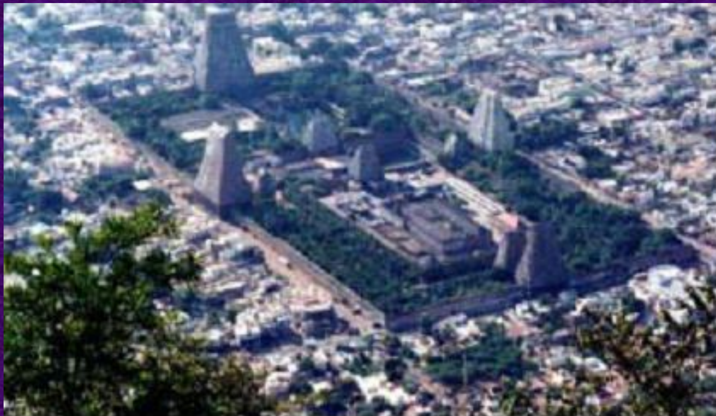
Храм Ангкор-Ват, Индия