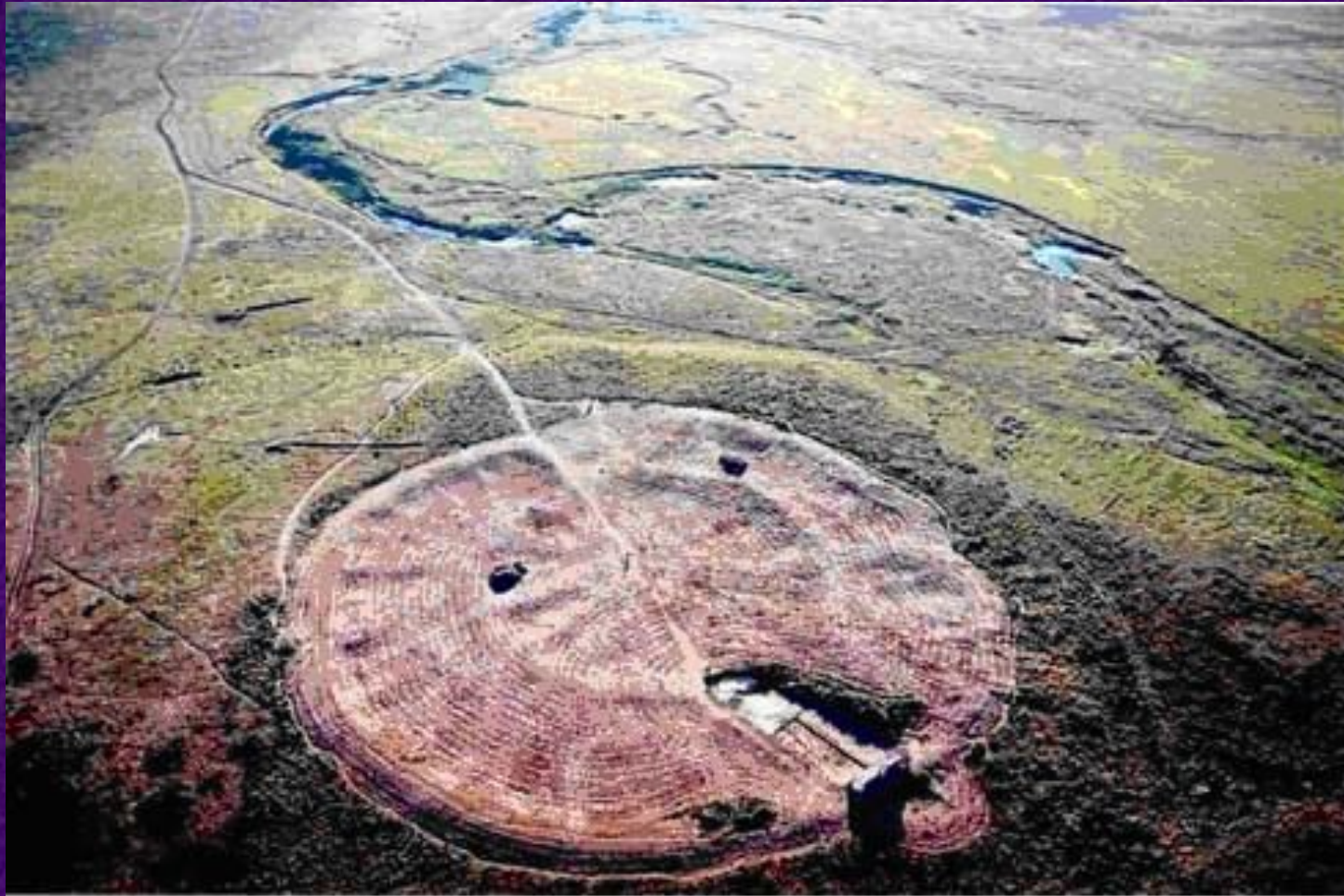
Рисунок 3. Вид раскопок города Аркаим.