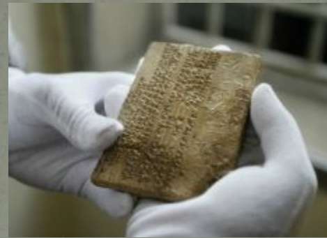
Ассирийские глиняные таблички. Музей истории Средиземноморья. Стокгольм.