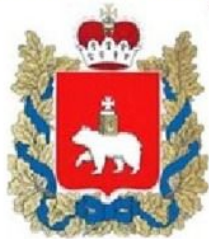
Герб Пермского края