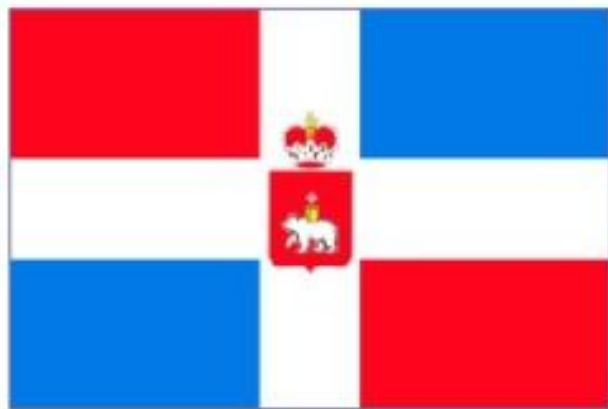
Флаг Пермского края

Пермский край – является субъектом Российской Федерации, расположен на Западном склоне Северного и Среднего Урала. Пермский край относится к Приволжскому федеральному округу.