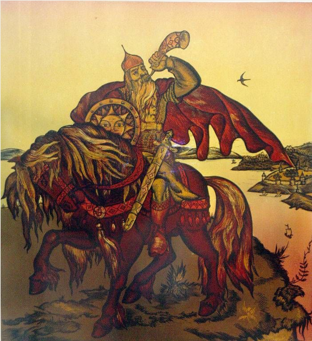
Е. П. Шитиков. «Илья Муромец». 1981 г.