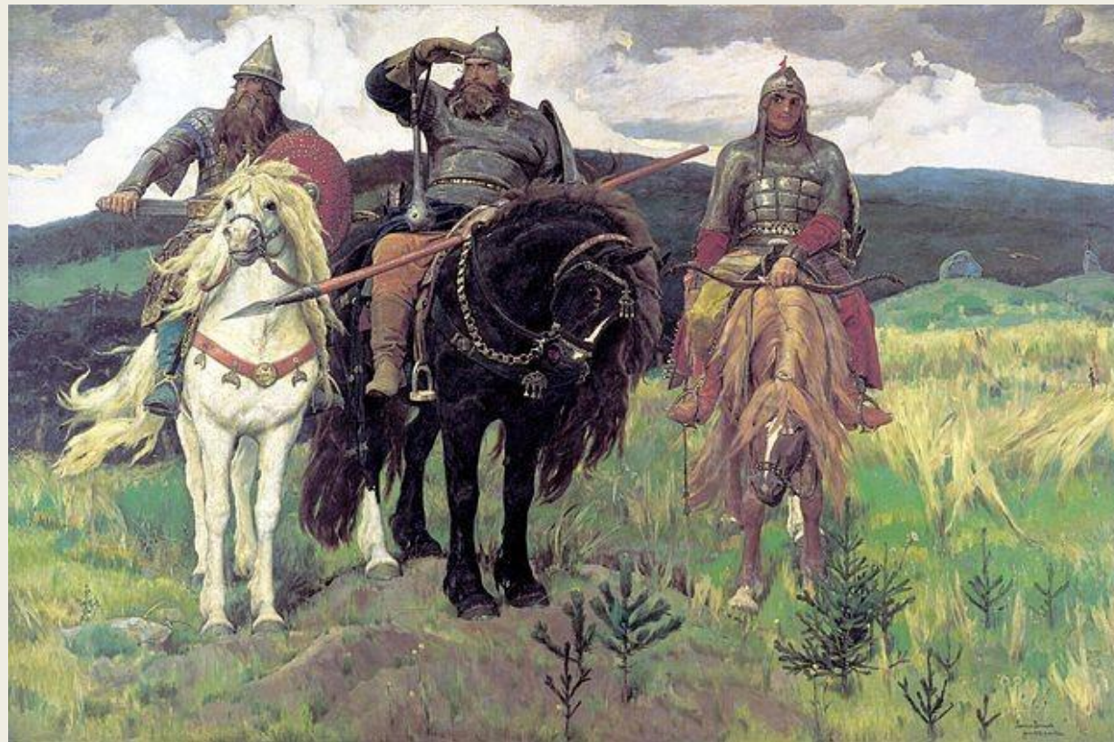
«Богатыри». Виктор Васнецов. 1881—1898. Изображение Ильи Муромца в центре