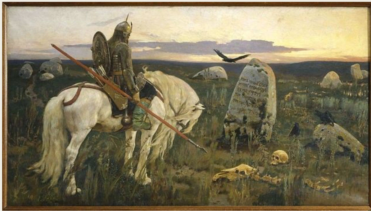
«Илья Муромец» Николая Рериха

Виктор Васнецов под впечатлением былины «Илья Муромец и разбойники» написал картину «Витязь на распутье».