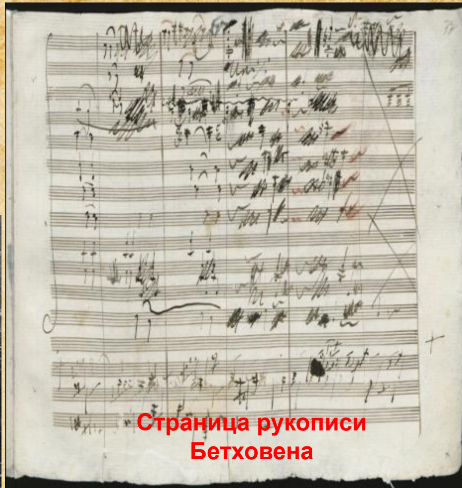
Страница рукописи Бетховена