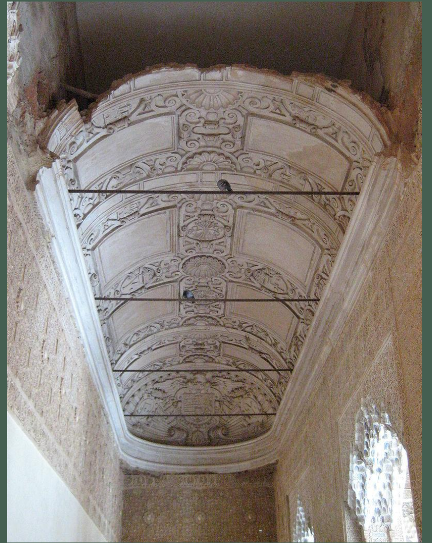
Bóveda de horno en el monasterio de San Pedro de Roda.