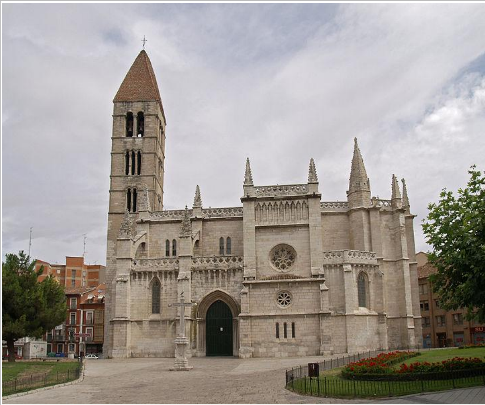
iglesia de Santa María de La Antigua de Valladolid