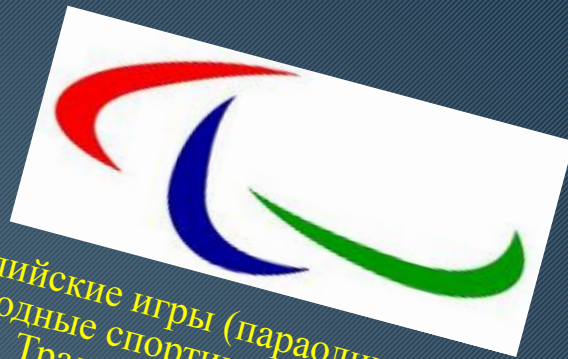
Эмблема параолимпийских игр

Параолимпийские игры (параолимпийские игры) — международные спортивные соревнования для инвалидов. Традиционно проводятся после главных Олимпийских игр, а начиная с 1992 — в тех же городах; в 2001 эта практика закреплена соглашением между МОК и Международным паралимпийским комитетом (МПК). Летние паралимпийские игры проводятся с 1960, а зимние паралимпийские игры — с 1976.