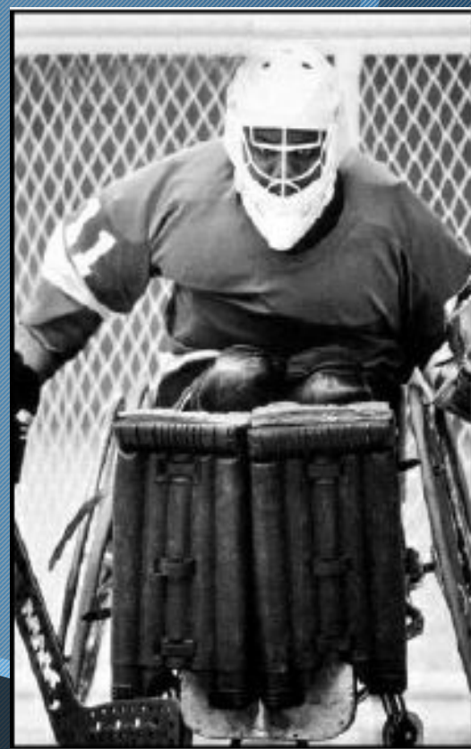
Людвиг Гуттман ( 3 июля 1899 — 18 марта 1980) „ Отец Паралимпийские игры “