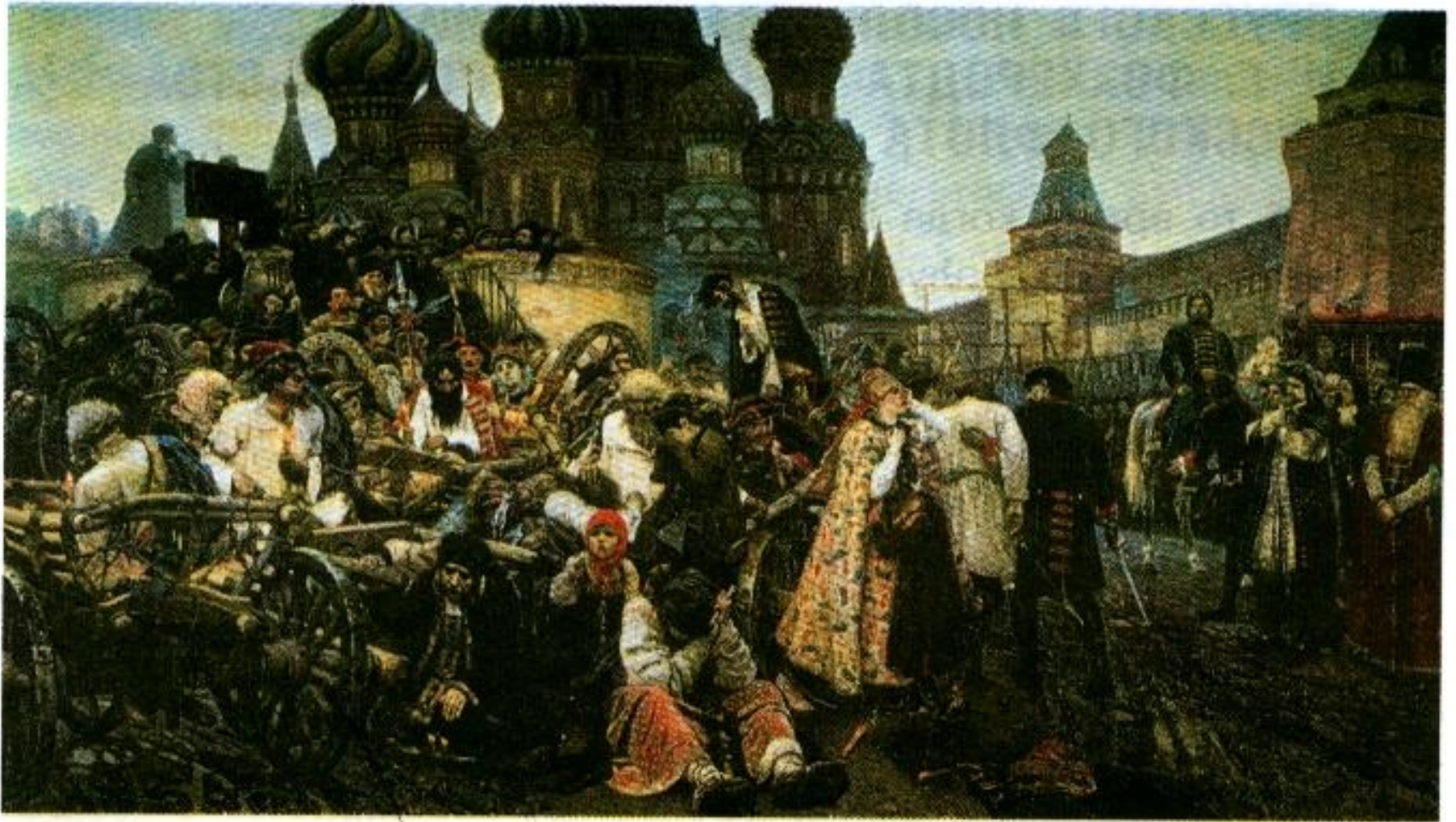
Утро стрелецкой казни. Художник В. Суриков.