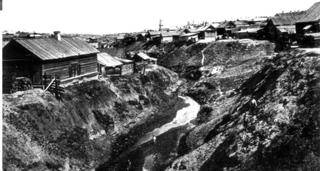
Саратовъ.—Saratoff. № 33. Глебучевъ оврагъ