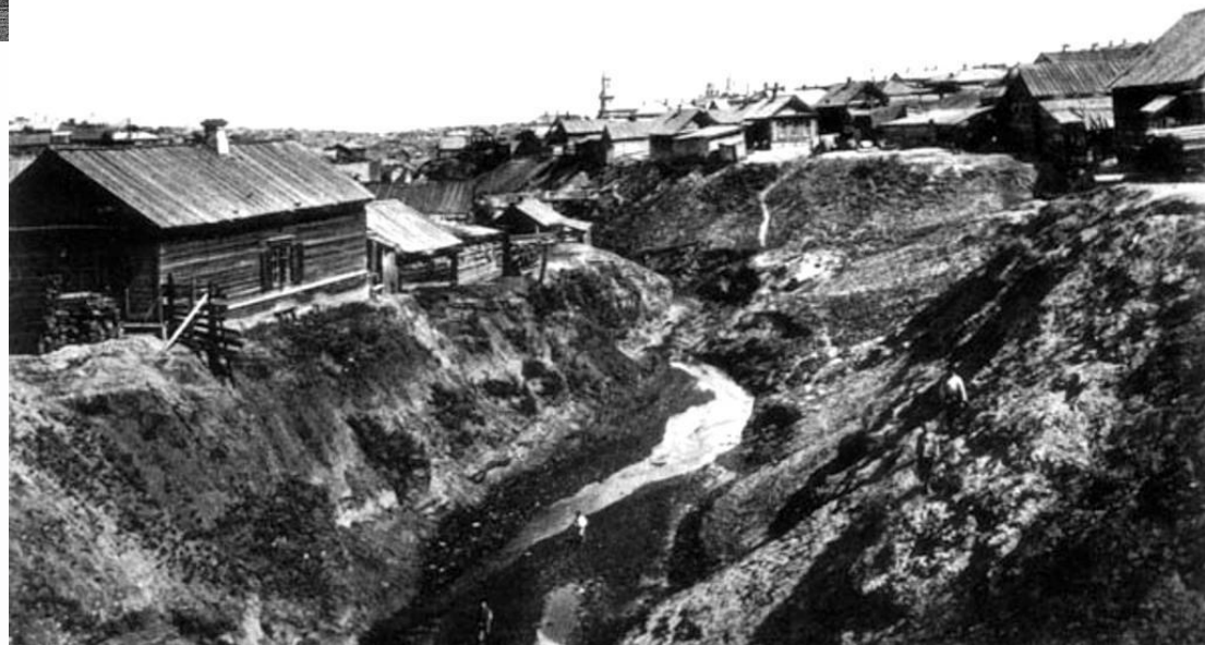
Саратовъ.—Saratoff. № 33. Глебучевъ оврагъ