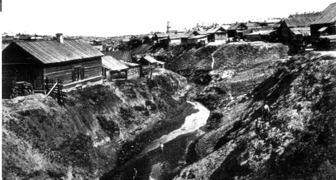
Саратовъ.—Saratoff. № 33. Глебучевъ оврагъ